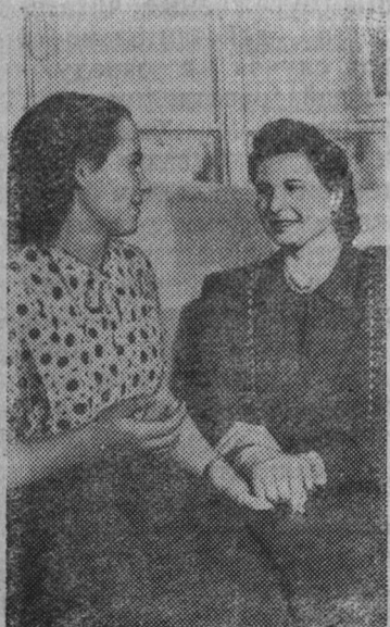
На первом областном слёте молодых доярок, проходившем в октябре текущего года, доярки Вологодской области вызвали доярок Архангельской области на соревнование за получение в новом хозяйственном году по 3.000—3.700 килограммов молока от каждой коровы.

Долг работников животноводства—приложить все силы к тому, чтобы самоотверженно трудиться каждому на своём посту и получить за зиму не менее 500—600 литров молока от коровы.