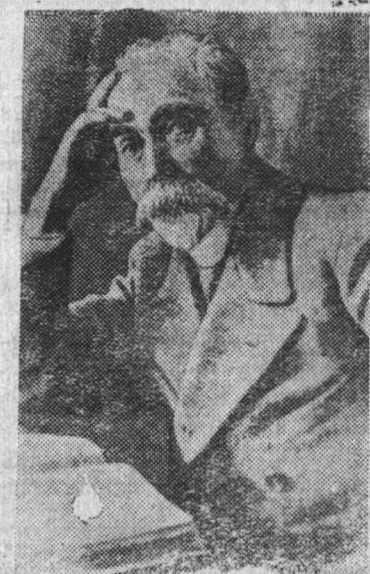
ПЛЕХАНОВ Георгий Валентинович (1856—1918 г.).

тересов буржуазии. Знание научного социализма рабочим нужно для непримиримой борьбы против буржуазии, для разрешения практических революционных задач.