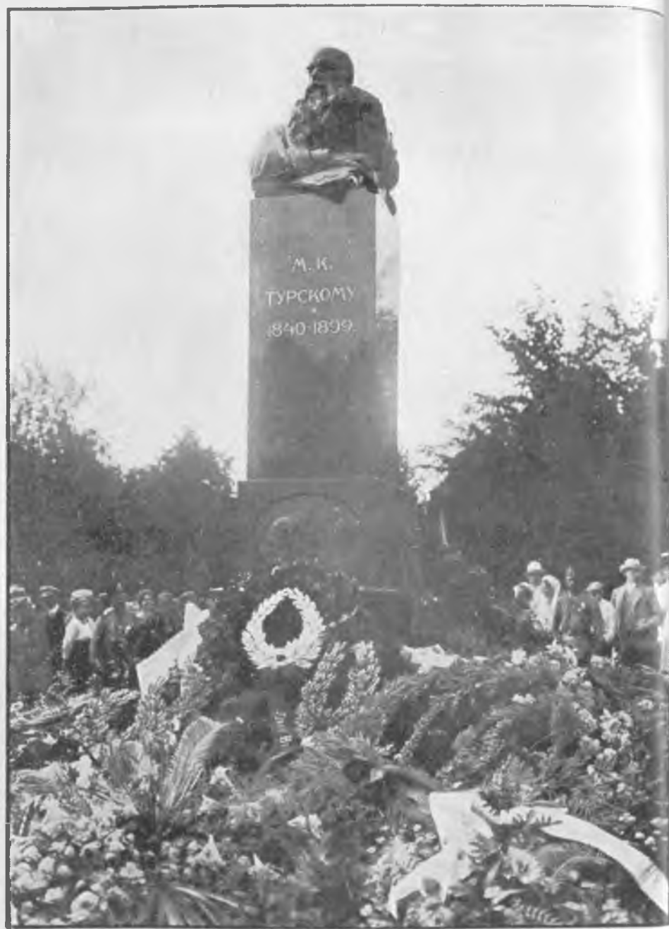
Памятник Проф. Митрофану Кузьмичу Турскому, открытый 1912 года.