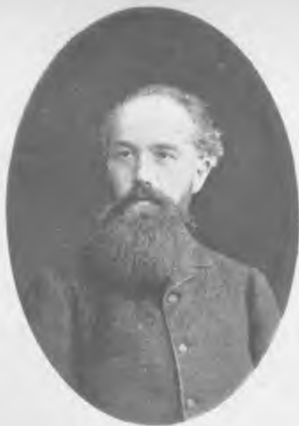
Проф. Иванъ Ивановичъ Иванюковъ. Снимокъ 1881 г.