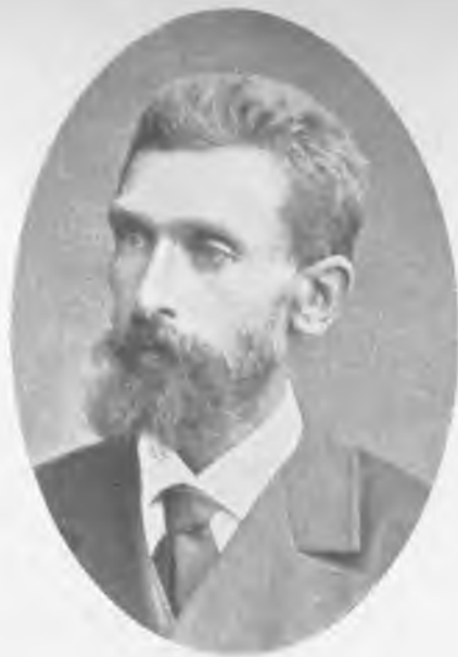
Проф. Б. Ф. Чижъ.