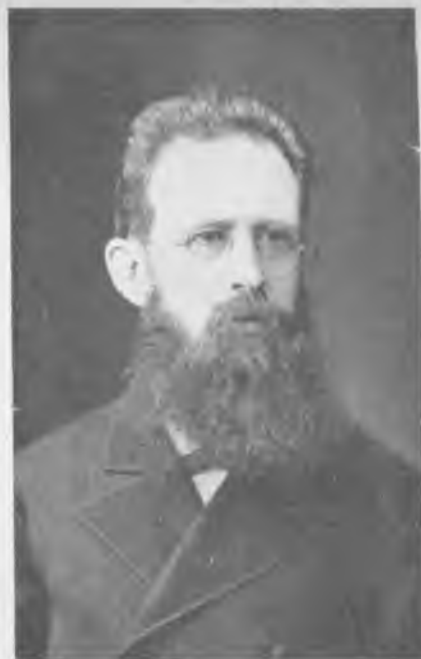
Проф. К. Э. Линдеманъ. Снимокъ 1881 г.