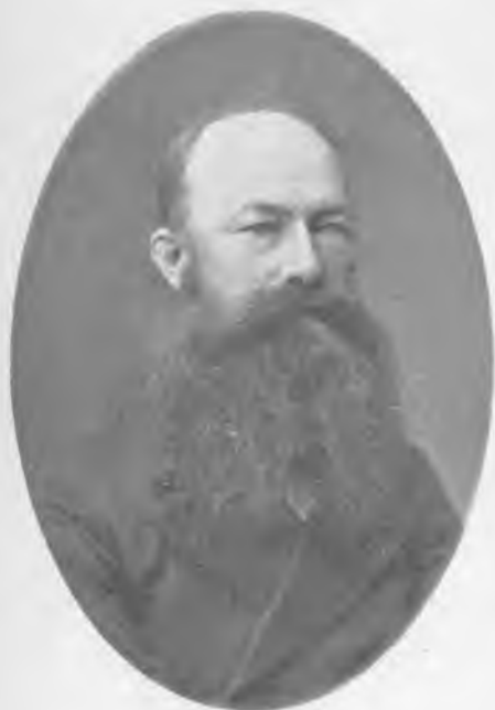
Проф. Митрофанъ Кузьмичъ Турскій. Снимокъ 1882 г.