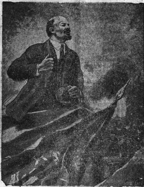
На сн.: картина Герасимова: „В. И. Ленин“. Музей Ленина. Зал: „Ленин в искусстве“).

Знамя Ленина, великое большевистское знамя борьбы за социализм понес вперед Сталин. Вечно будет жить в сознании народов, в сердцах всех благодарных потомков