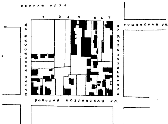
Рис. 1. Вологда. План квартала № 30. 1910—1912 гг.

ская). С юга и запада мемориальный комплекс ограничивается улицами Урицкого (бывш. Большая Козленская) и Пушкинской (бывш. Малая Духовская).