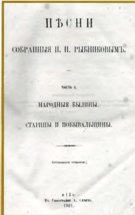
Титульный лист книги П.Н. Рыбникова

По мнению исследователей, заслуга Рыбникова состоит в том, что он открыл и сделал достоянием русской