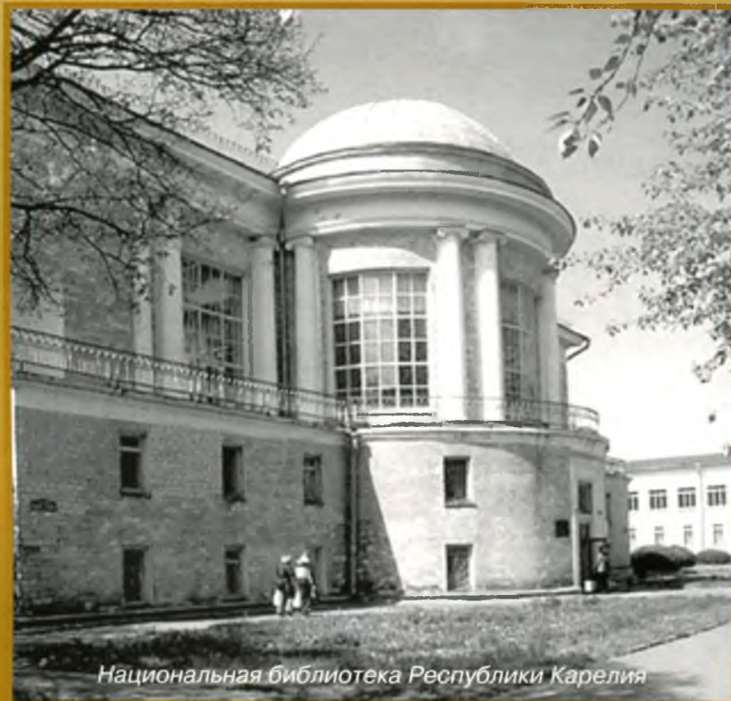
Национальная библиотека Республики Карелия