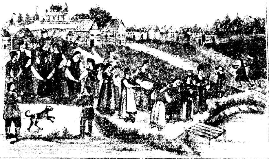
Рис. 2. Похороны Костромы («Вестник археологии и истории», вып. XX, СПб., 1911, стр. 91)