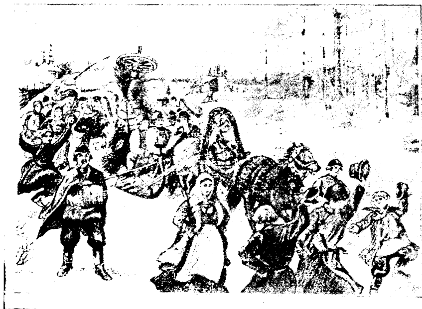
Рис. 1. Сожжение чучела масленицы (гравюра из книги: А. Е. Бурцев, Обзор русского народного быта Северного края, СПб., 1902, т. III, стр. 97)

ряде, теперь же стараются незаметно или совсем снять платье и платок, или заменить их тряпьем» 27 .