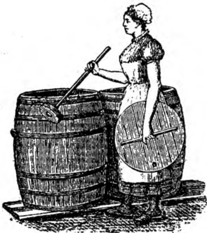
Рис. 12. Квасильные чаны.

При маслодѣлн, какъ уже неоднократно было упомянуто, необходимо соблюденіе во всемъ безусловной чистоты, какъ въ самой маслодѣлн, такъ въ особенности во всемъ томъ, что касается процесса квашенія сливокъ. Въ виду того важнаго значенія, которое имѣетъ равномерность температуры сквашиваемыхъ сливокъ во все время скисанія, безспорно, самой цѣлесообразной посудой должно считать деревянные кадки (показанныя на рис. 12), хорошо сдѣланныя изъ крѣпкаго дерева (дуба) и содержимыя въ безусловной чистотѣ, для чего требуется имѣть двойной комплектъ квасильныхъ чановъ, что-