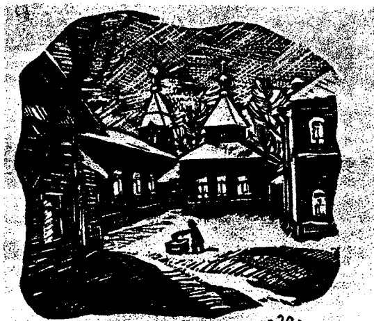
Череповец Леушинское подворье 20 годов

Сегодня мы показываем две гравюры художника и стихотворение.