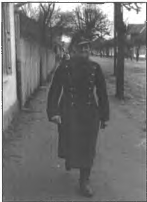
Фотография из личного дела польского военнопленного