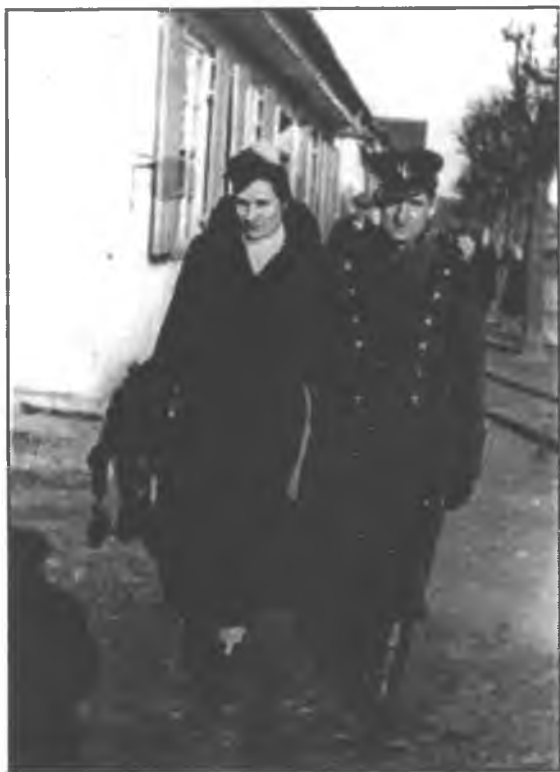
Фотография из личного дела польского военнопленного