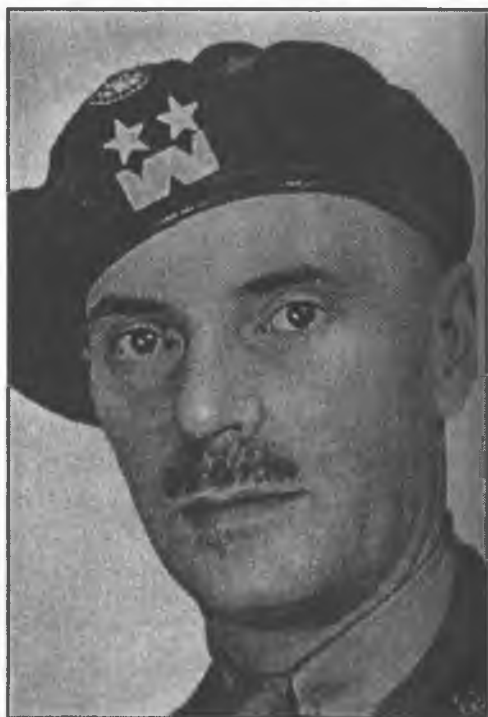
Владислав Андерс. Командующий Польской армии в СССР