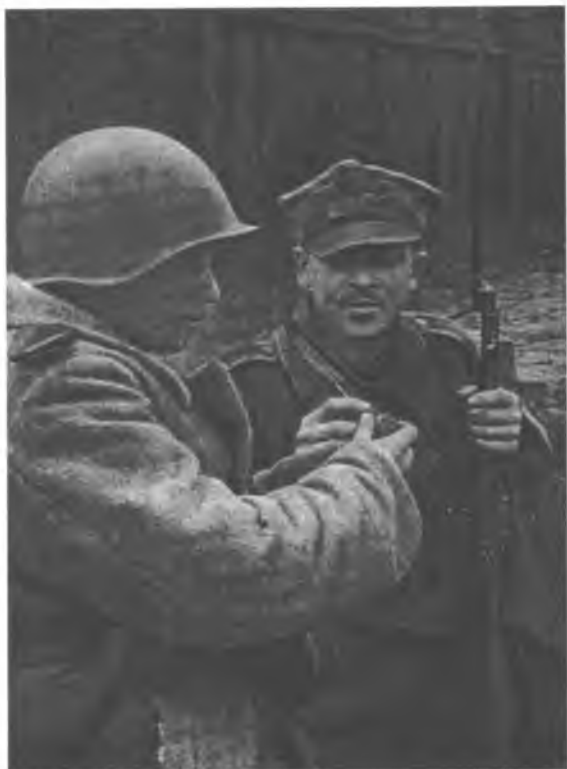
Красноармеец и боец 1-й Польской армии генерала З. Берлинга. 1-й Белорусский фронт. Октябрь 1944 г.