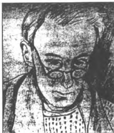
Юзеф Чапский. Автопортрет. 1940 г. Юхновский лагерь