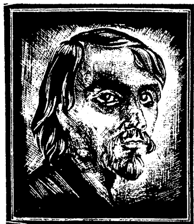
Ю. Максин Гравюра Е. Лебедева

В минувшем году была опубликована книга писателя Вячеслава Белкова «Рубцов сегодня» (очерки и размышления). Объем ее невелик, но это очень «густая» книга.