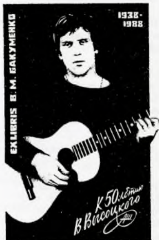
Худ. А. Г. Шибанов