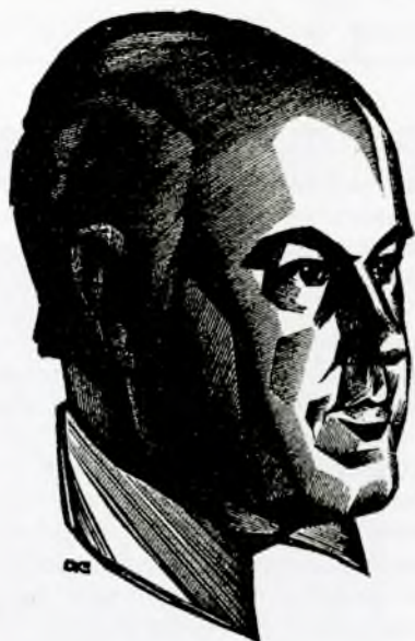
Автопортрет. Худ. А. И. Калашников