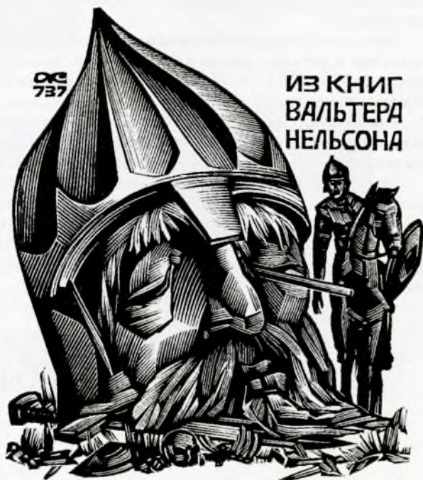
Худ. А. И. Калашников (Москва).