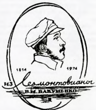
Худ. В. Ю. Розенталь