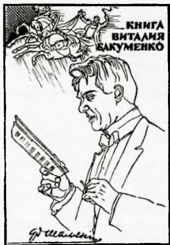
Худ. Бондаренко Н. М.