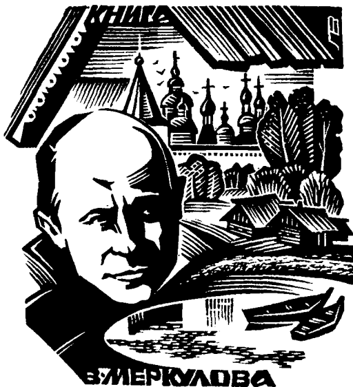
Худ. В. Леоненко