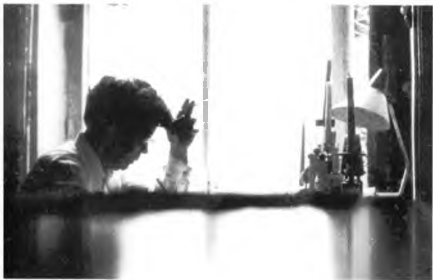
За работой. Родается музыка.