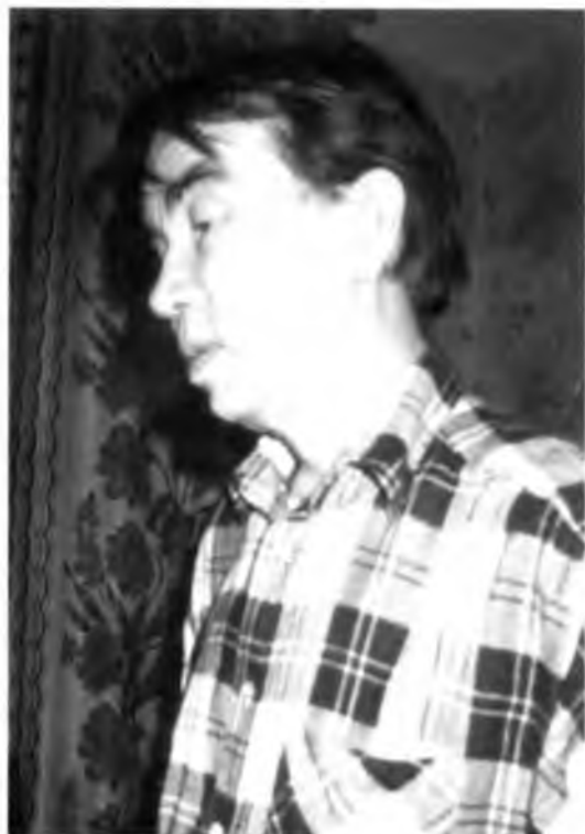
Последнее фото В. Гаврилина. 24 января 1999 года.