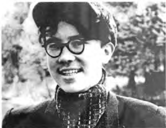
Валерий Гаврилин. Музыкальная школа-десятилетка. Ленинград. 1950-е годы.