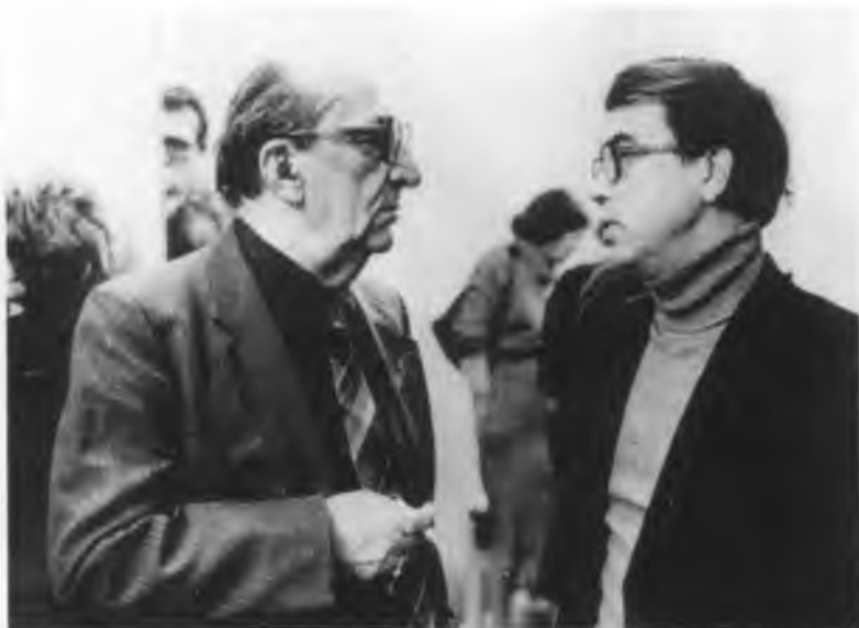
В. А. Гаврилин с Г. А. Товстоноговым. 25 сентября 1986 года.