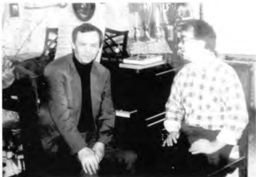
С Валентином Распутиным.