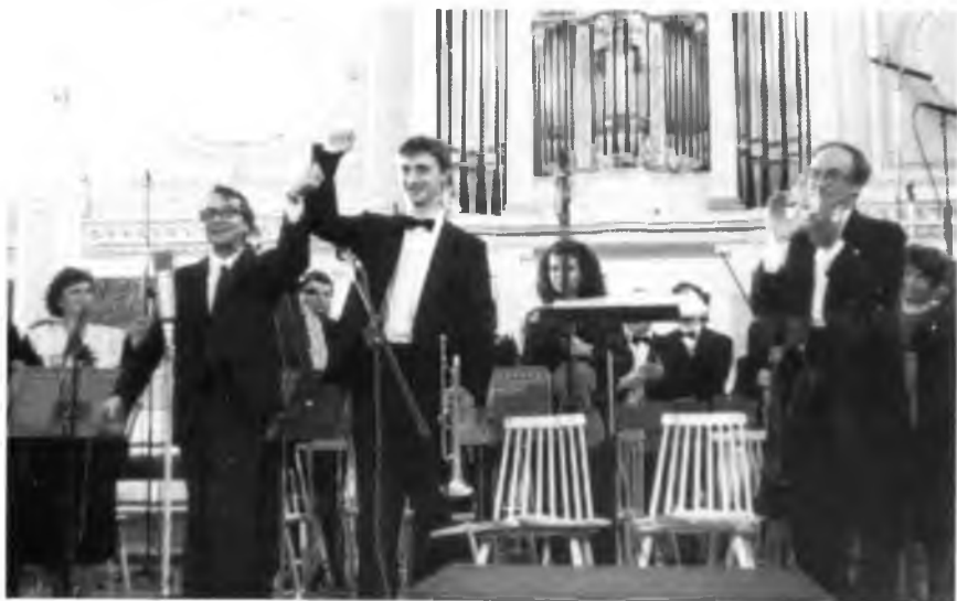
Капелла. В. Гаврилин на сцене с оркестром. 18 мая 1998 года.