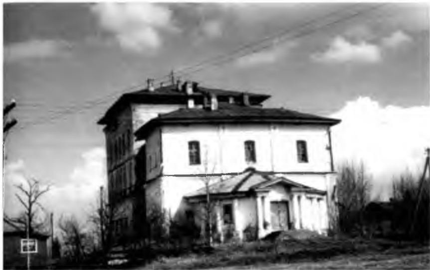
Так выглядел храм в Воздвижение в детские годы Гаврилина.