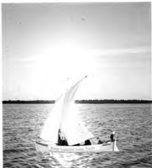
Вид на Кубенское озеро.