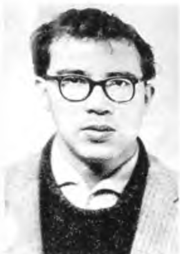
Август 1965 года.