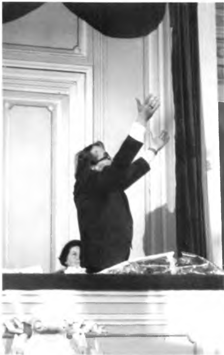
Капелла. В. Гаврилин приветствует зрителей балкона и галерки. 18 мая 1998 года.