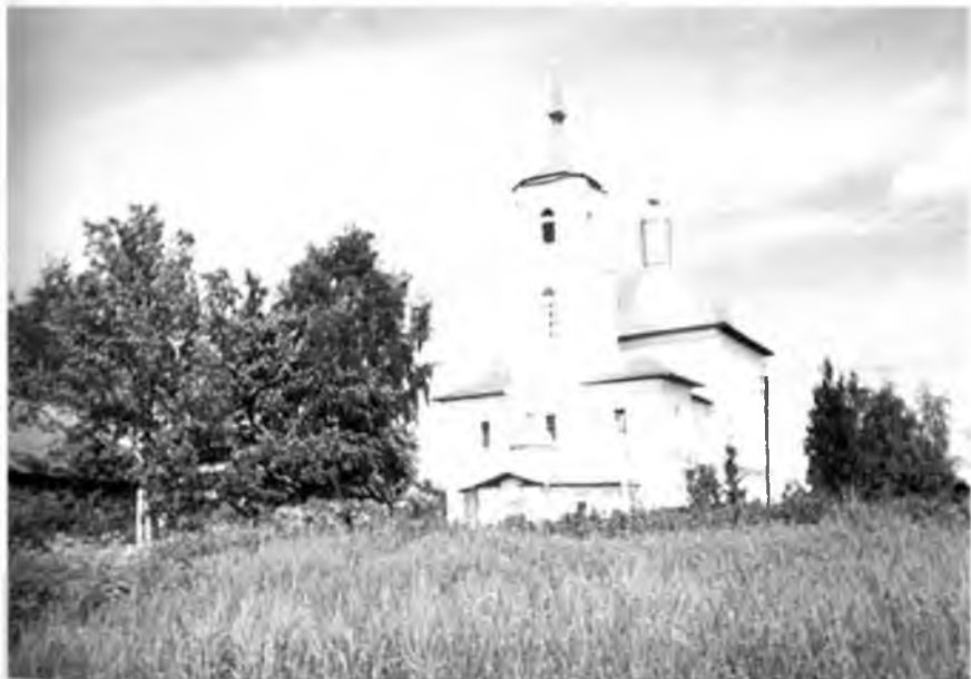
Современный вид храма (после реставрации).