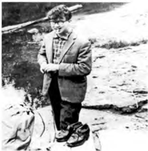
В фольклорной экспедиции.