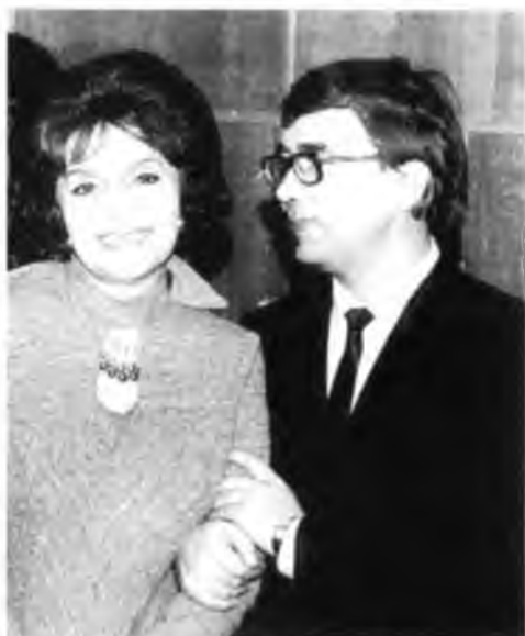
В. А. Гаврилин с Зарой Долухановой.