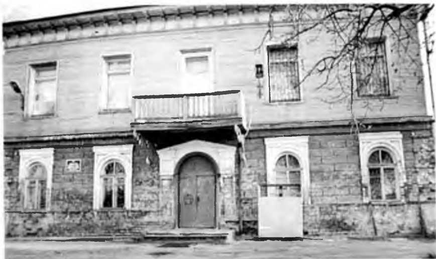
Детский дом в Ковырине, где воспитывался мальчиком Гаврилин.