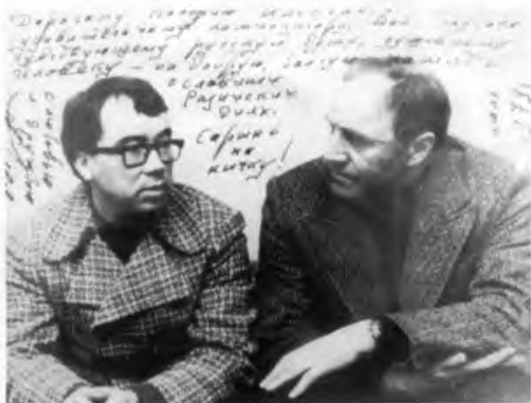
С Михаилом Ульяновым.