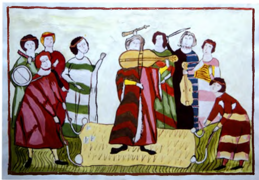
Рис. №10 Маранов Женья (Тотьма) Бова. Пир