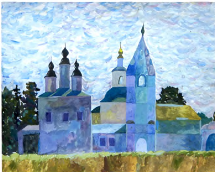
Рис. №15 Думин Артем (Кириллов) Северный град