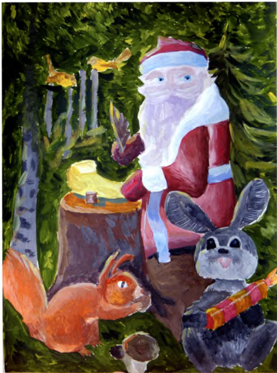
Рис. №12 Дьяконова Ира (Великий Устюг) Чудесный подарок