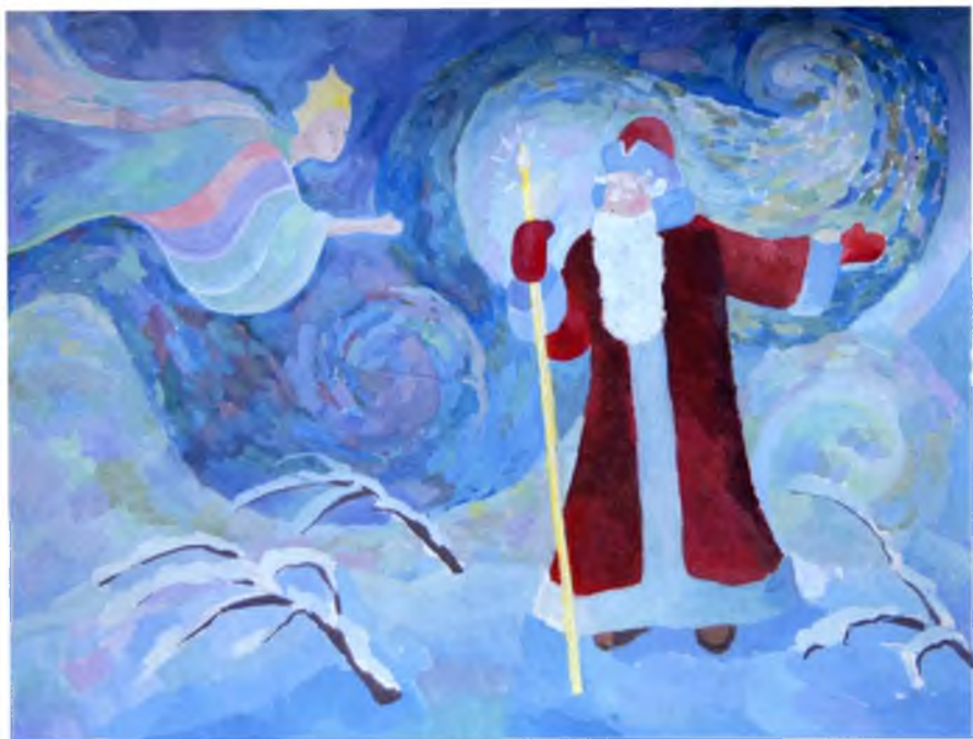
Рис. №9 Прокшина Оля (Великий Устюг) Чудесный подарок