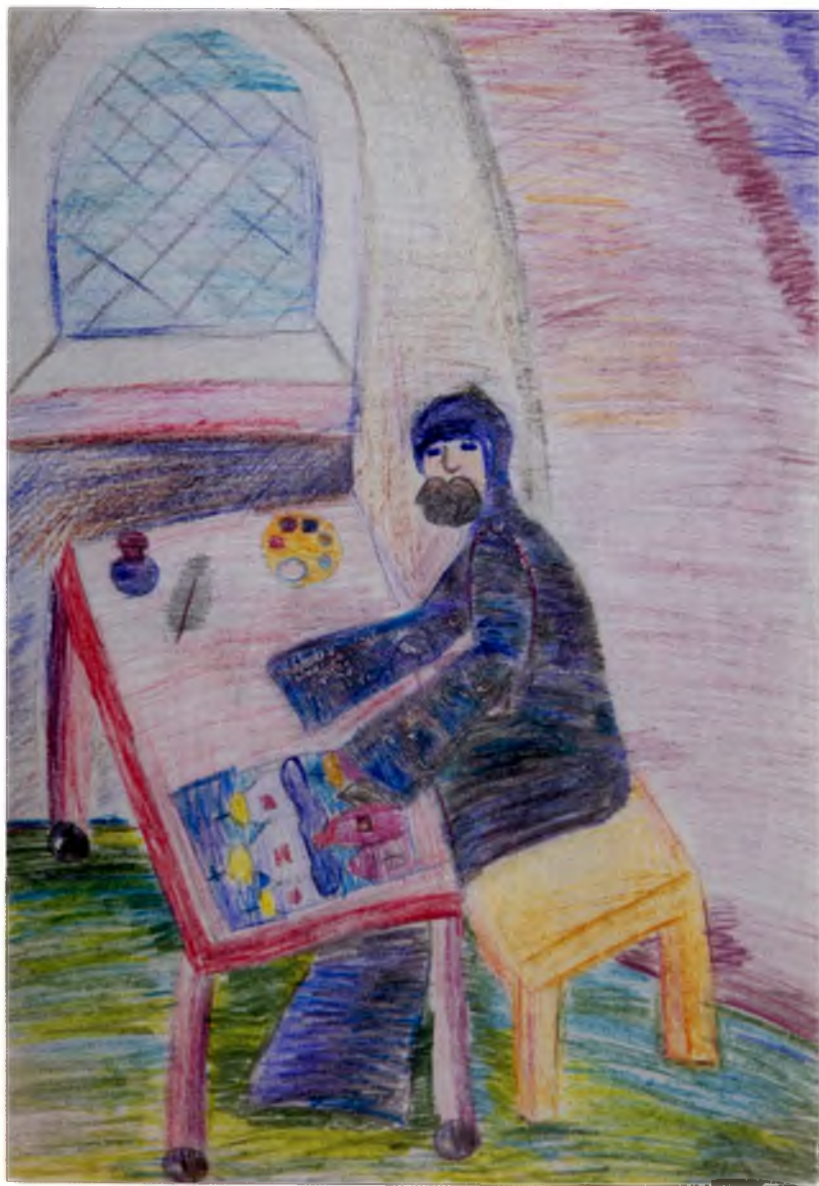
Рис. №2 Кузнецова Маша, 10 лет (Вологда) Летописец