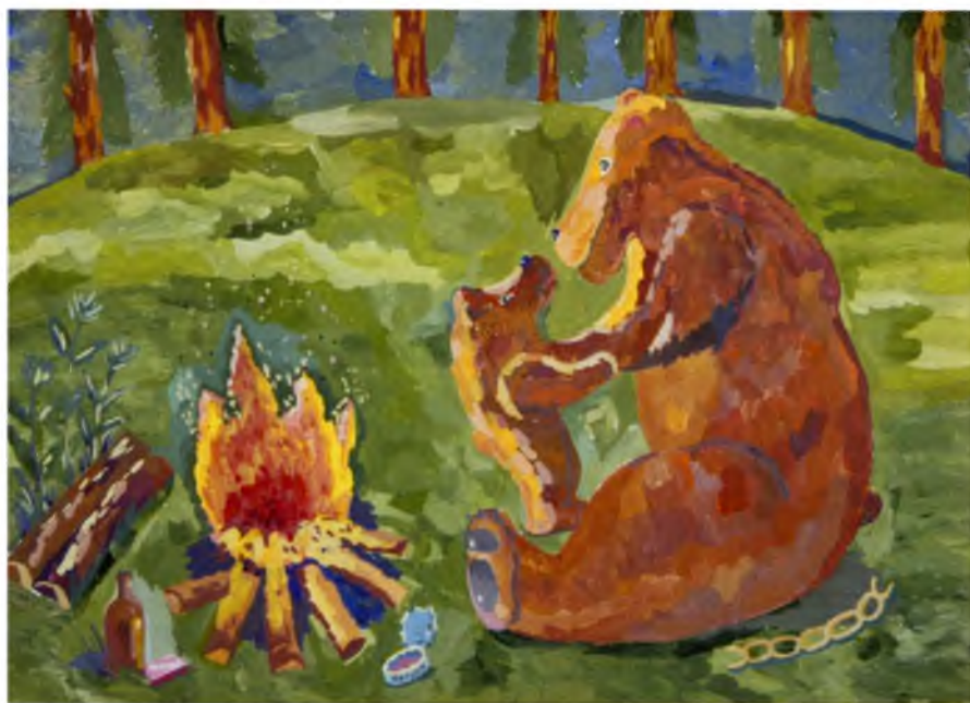
Рис. №13 Сергеева Настя (Великий Устюг)