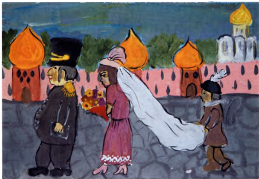
Рис. №5 Гусева Маша, 9 лет (Вологда) Золотые трубы