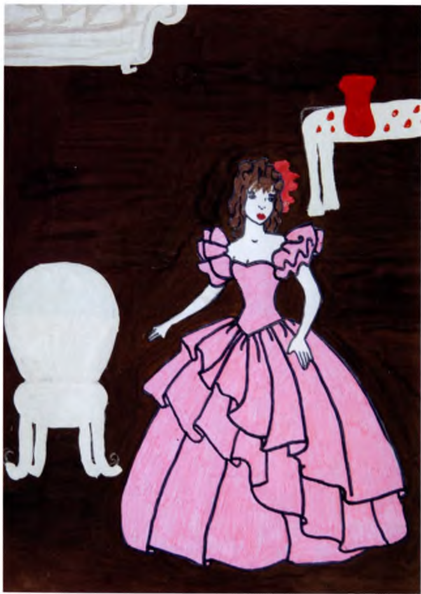
Рис. №6 Смирнова Юлия (Вологда) Вологодский клад