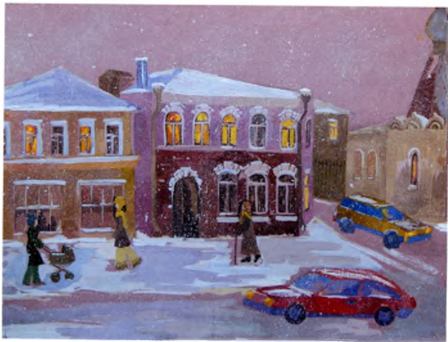
Рис. №16 Ефремова Маша (Череповец) Советский проспект в Череповце