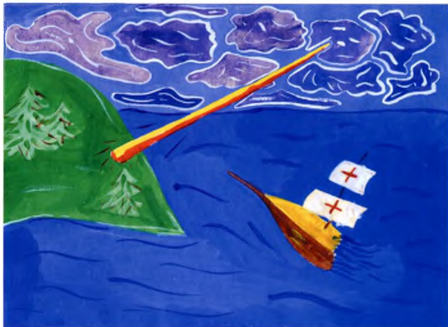
Рис. №3 Настя Телушкина (Череповец) Легенда об основании Череповца