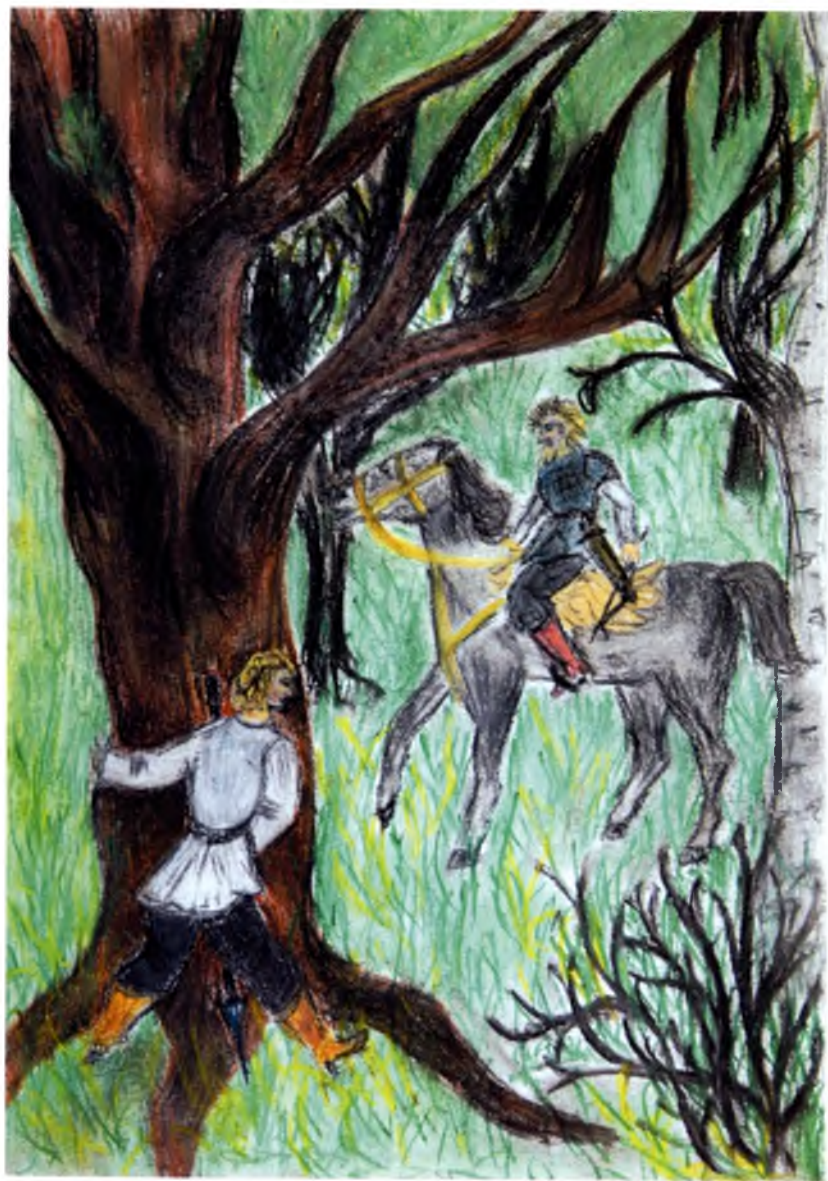
Рис. №4 Жирохова Эля (Вологда) Бова