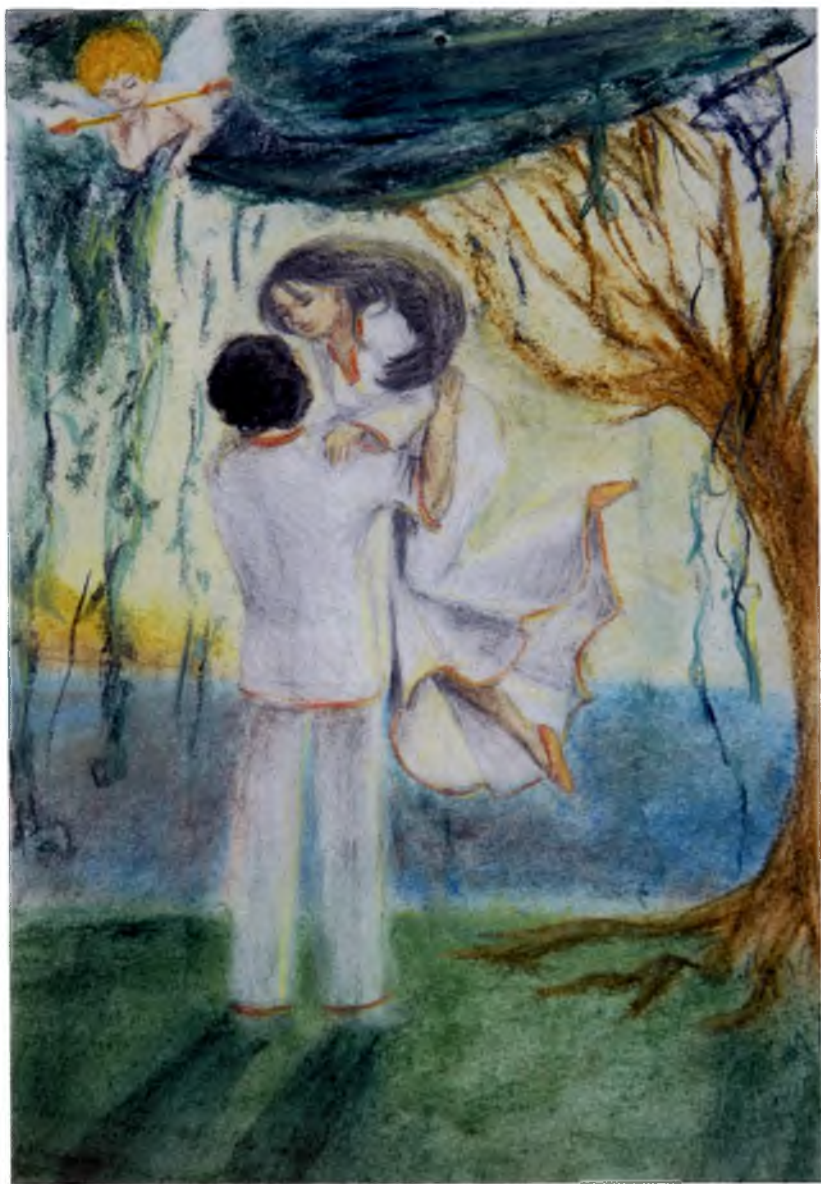
Рис. №7 Белокурова Яна (Вологда) Любовь Бовы