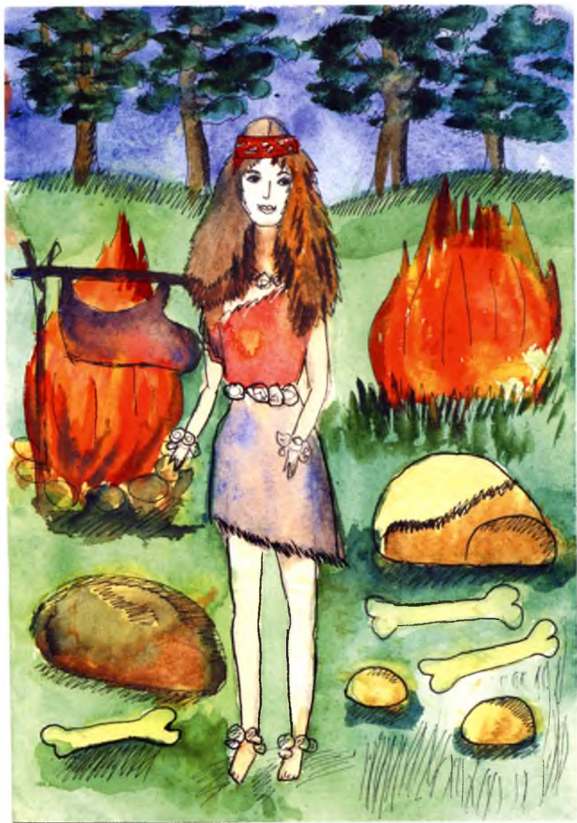
Рис. №1 Ратникова Тania, 8 лет (Вологда) Ожерелье доисторической девочки