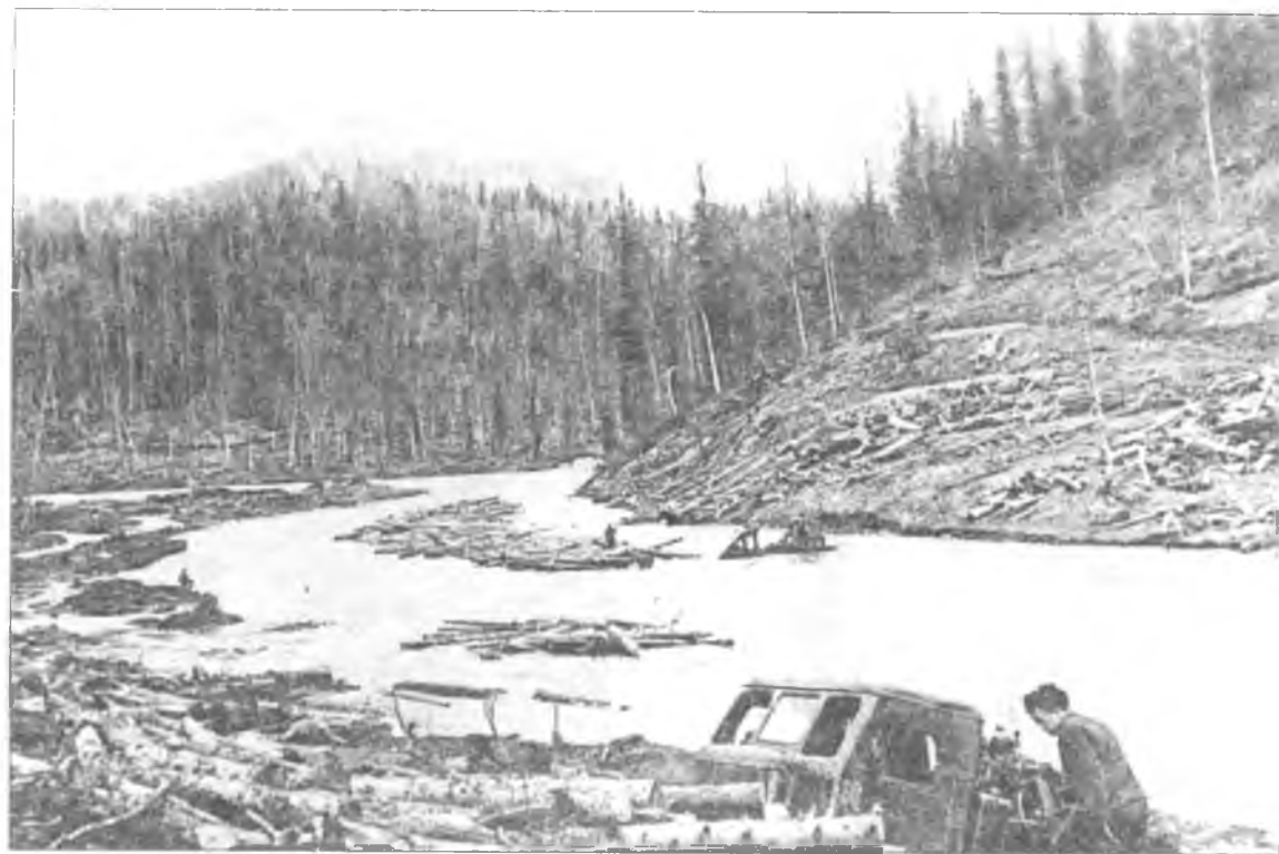
Заключенные на лесосплаве