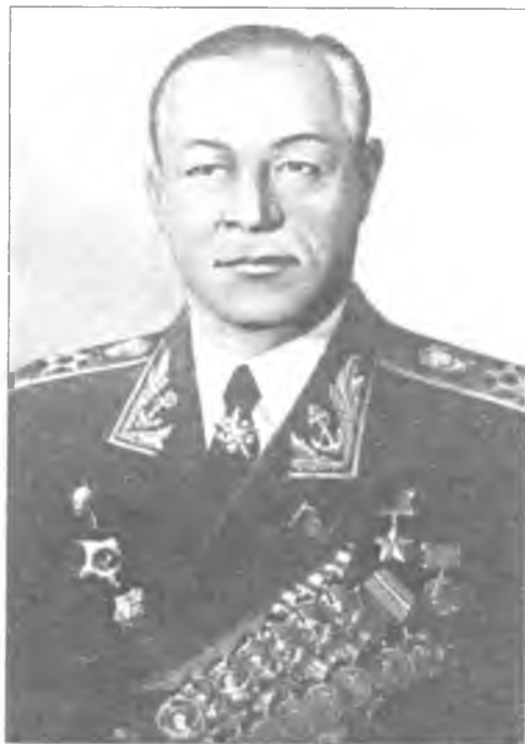
Н.Г. Кузнецов – нарком ВМФ СССР, Герой Советского Союза