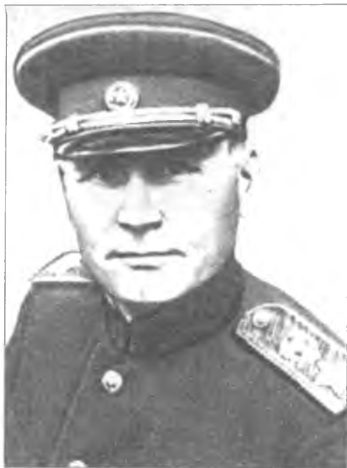
И.С. Конеv – маршал Советского Союза, дважды Герой Советского Союза