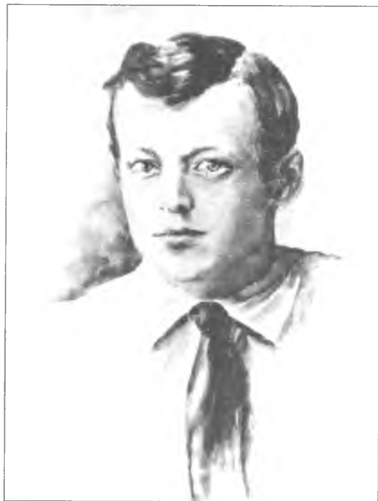
А.А. Ганин – поэт, расстрелянный по решению коллегии ОГПУ