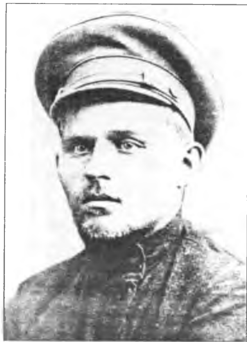
И.П. Белов – командарм 1-го ранга