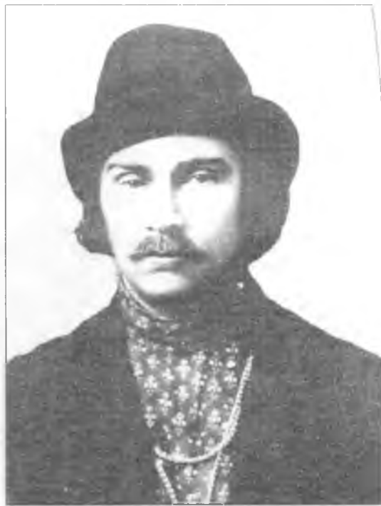
Н.А. Клюев – русский крестьянский поэт