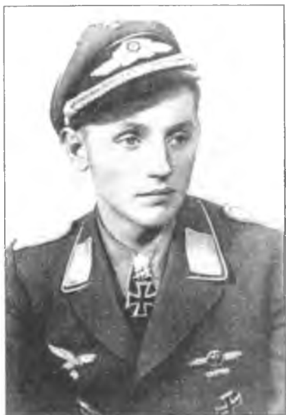
Эрих Хартман – лучший ас Второй мировой войны, позднее военнопленный Грязовецкого и Череповецкого лагерей