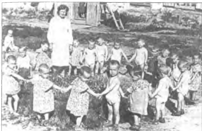
Дети в лагерном детском саду