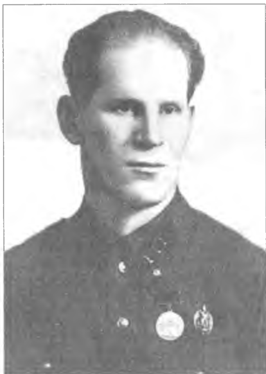
Л. Ф. Галкин – начальник УНКВД по Вологодской области (1941–1943)