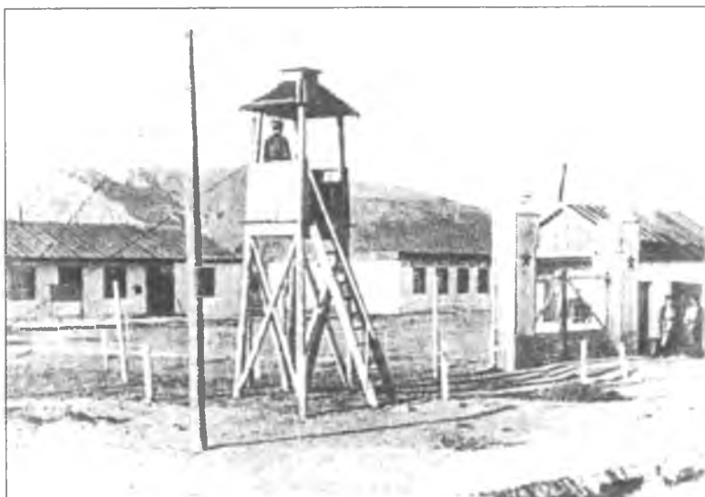
Сторожевая лагерная вышка