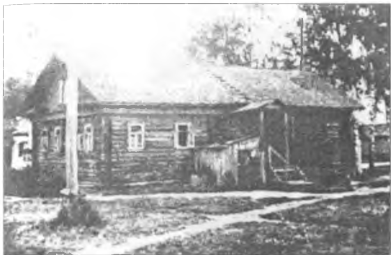
Комендатура Череповецкого лагеря для военнопленных № 158