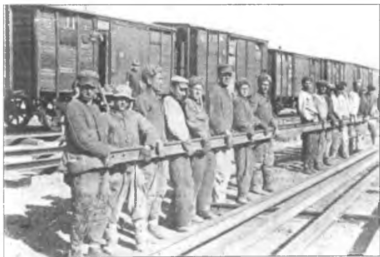
Военнопленные на укладке рельсового полотна