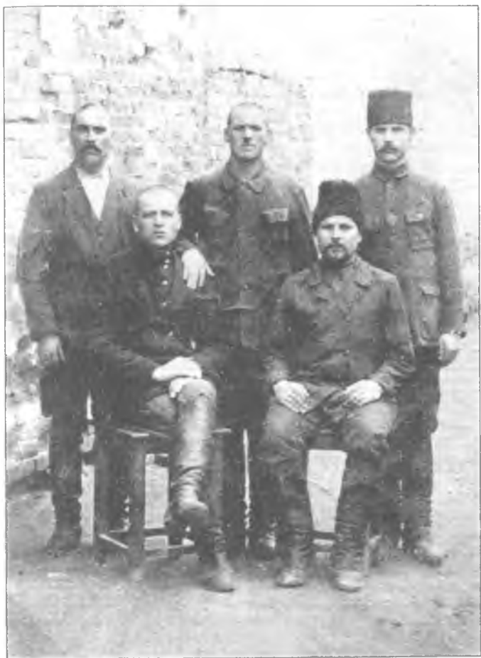
Группа украинцев, высланных в ссылку в Северный край в 1931 году по ст. 54 УК УССР