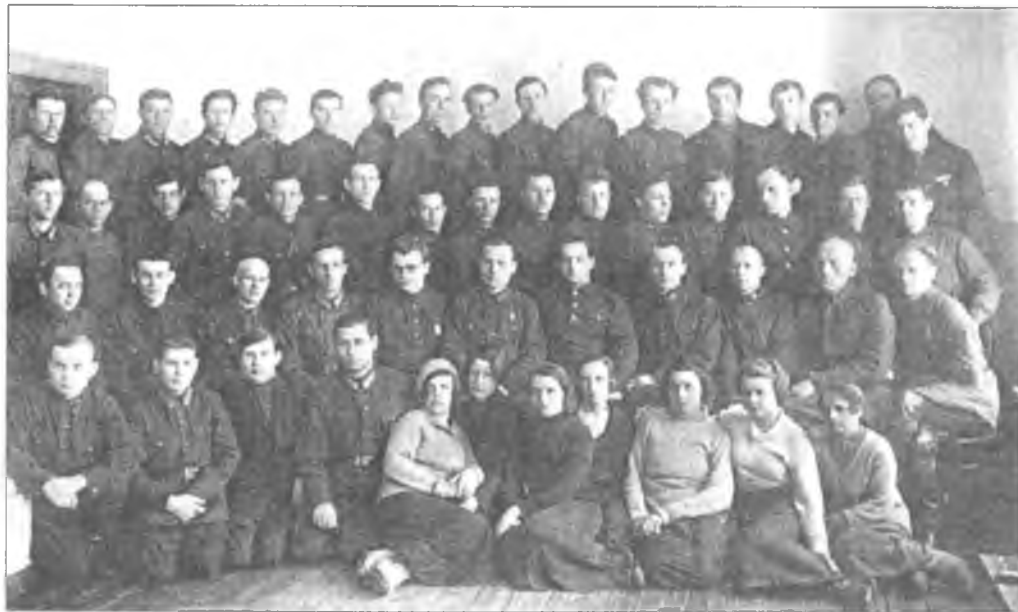
ОГПУ г. Вологды. 1932 год