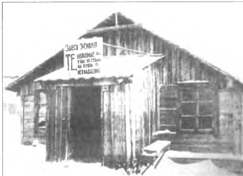
Барак для бригад, невыполнивших производственный план