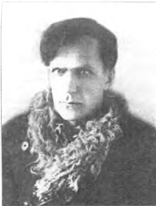
В.Т. Шаламов – писатель, автор «Колымских рассказов»