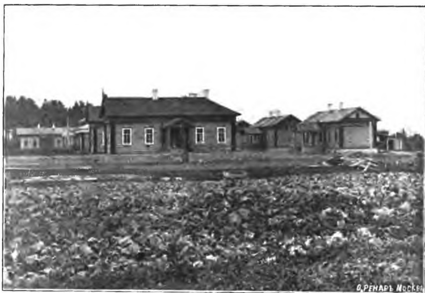
Рис. 6. Деревянная колонія.

Баракъ для заразныхъ больныхъ (см. табл. Е) представляется зданіемъ, построеннымъ изъ смѣшаннаго елового и соснового лѣса, поставленнымъ на деревянные столбы и крытымъ тесомъ. Зданіе это состоитъ изъ