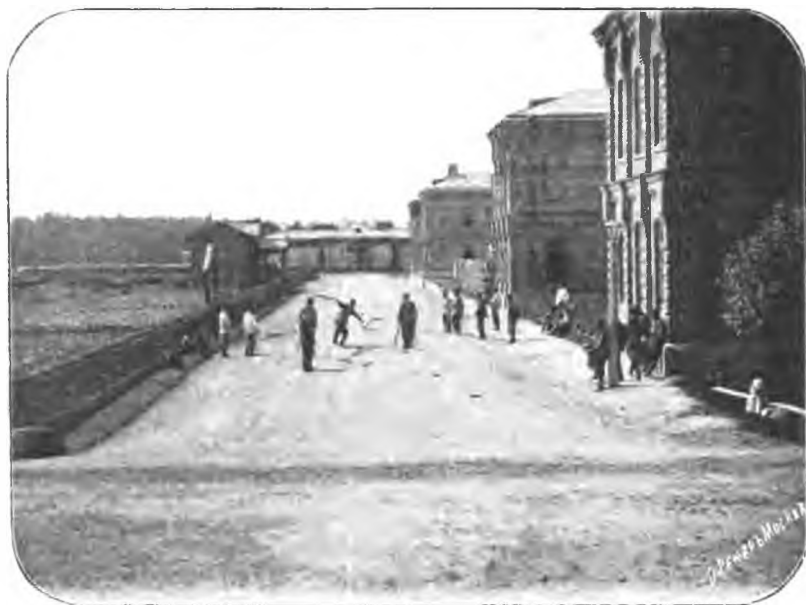
Рис. 10. Игра больныхъ въ городки.

домъ и ужиномъ, точно такъ же, какъ и по окончаніи ихъ, больные вмѣстѣ съ служителями участвуютъ въ общей молитвѣ. По окончаніи чая, обѣда и ужина курящіе больные получаютъ по 2 пашросы, такъ что въ течение дня на каждаго курящаго больного приходится 8 пашросъ. Въ лѣтнее время громадное большинство больныхъ весь день проводятъ на открытомъ воздухѣ, въ нашихъ садахъ и огороженныхъ дворикахъ. Подъ ихъ обширными навѣсами организуются общія столовыя, и больные, съ утра выходя въ сады, возвращаются въ отдѣленія лишь вечеромъ, ко времени укладыванія въ постели, обѣдая и ужиная подъ навѣсами садовъ. Въ эти сады мы переносимъ совѣмъ съ кроватями также и тѣхъ физически-слабыхъ