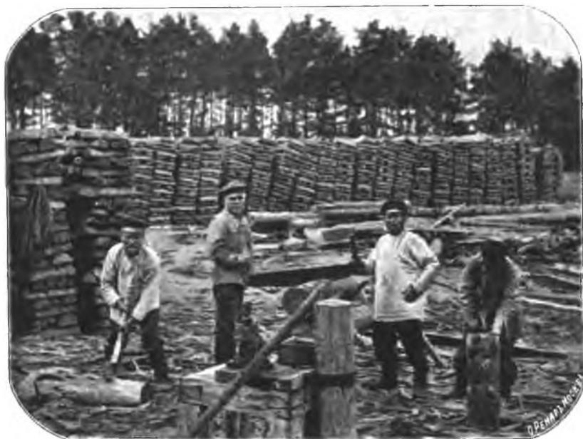
Рис. 16. Четыре паралитика за колькою и распиловкой дровъ.

Порядокъ поступления душевно-больныхъ въ нашу лечебницу регулируется нижеслѣдующими правилами, утвержденными нашимъ Губернскимъ Земскимъ Собраніемъ въ 1896 году. Изданіемъ обязательныхъ по сему