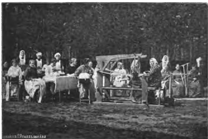
Рис. 14. Разнообразныя домашнія работы больныхъ женщинъ въ саду.

Памъ остается сказать про общія работы по лечебницѣ.