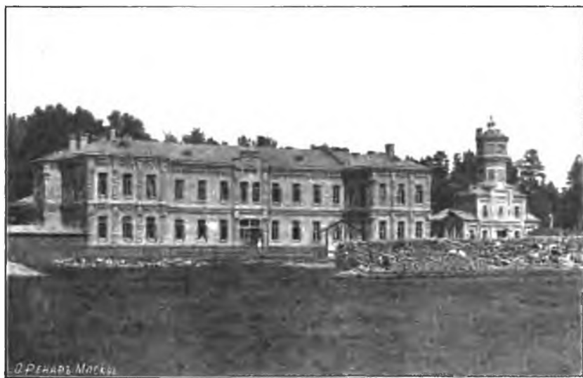
Рис. 5. Женскія каменныя корпусъ и водопапорная башня.

Женскія каменный павильонъ (см. табл. 3) имѣетъ видъ буквы Н. Передній фасадъ его въ два этажа, задняя часть обѣихъ ножекъ его въ одинъ этажъ. Нижній этажъ состоитъ изъ слѣдующихъ помѣщеній: прихожая, приемная (въ ней же приспособленія для электро-тераши), столовая, двѣ большія спальни, двѣ комнаты для фельдшерницъ, двѣ небольшія комнаты для прилуги, 12 одиночныхъ спаленъ, три ванныя комнаты, небольшая кухня для разогрѣванія пици. Отдѣлене это имѣетъ шесть