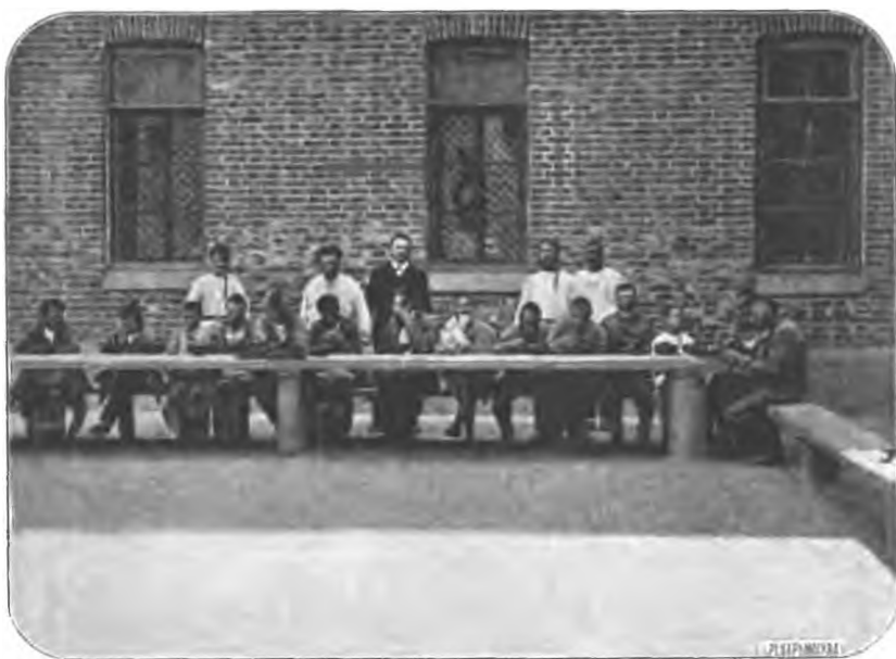
Рис. 8. Обѣдъ больныхъ въ буйномъ отдѣленіи. (Моментальная фотография врача Югансонъ).

8) Дежурный слѣдитъ за точнымъ распределеніемъ по отдѣлениямъ всѣхъ экстръ и дополнительныхъ порціи.