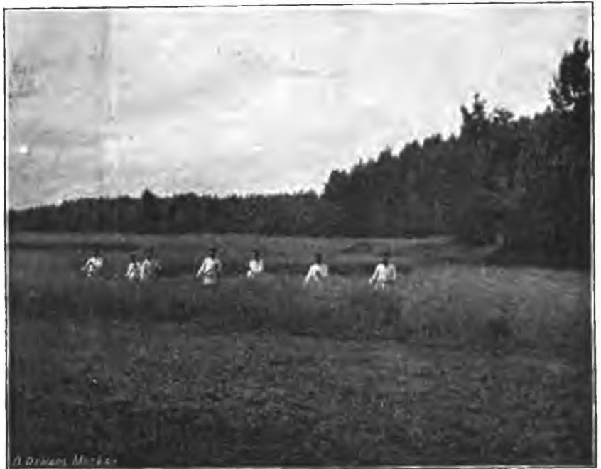
Рис. 12. Больные на покосѣ. (Моментальная фотографія А. Яковлева).

Работы въ теплицахъ, выгрузка и набивка парниковъ, перенутовка огородной земли, дѣланіе грядъ, полотье ихъ, поливка, сборъ овощей,