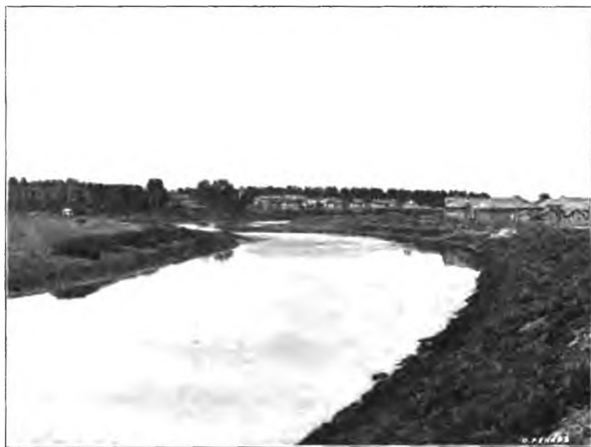
Рис. 1. Общий видъ лечебницы для душевно-больныхъ въ с. Кувшиновѣ.

Сельцо Кувшиново расположено въ 5 верстахъ отъ г. Вологды, къ сѣверо-западу отъ него; оно стоитъ на лѣвомъ берегу рѣки Вологды и расположено въ высокой мѣстности съ песчанымъ грунтомъ. Всей усадебной земли при лечебницѣ числится около 40 десятинъ. Около половины этого