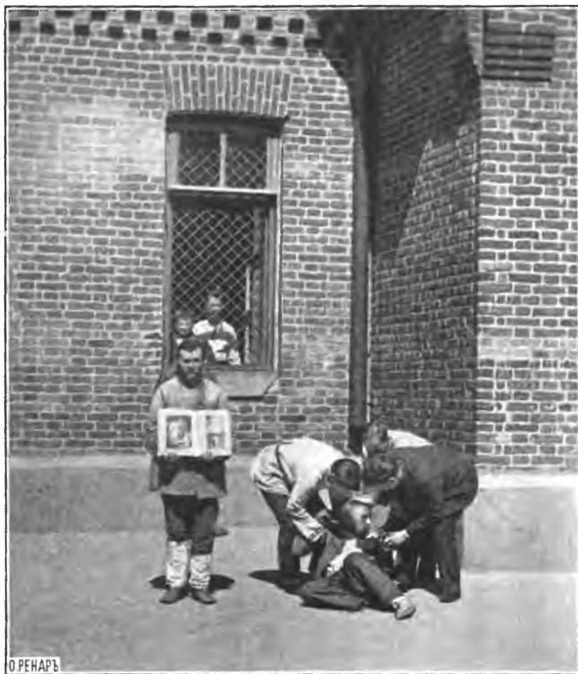
Рис. 3. Окно, защищенное сѣткой. (Видъ со стороны двора для буйныхъ больныхъ и эпилептиковъ).

водные трубы клозетов снабжены водяными затворами. Обычные деревянные стулья клозетов, имѣюще видъ деревянныхъ ящиковъ, въ настоящее время уничтожены и замѣнены массивными металлическими треножниками, вѣданными въ полъ и снабженными въ своихъ верхнихъ частяхъ деревян-