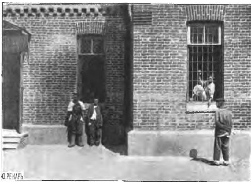
Рис. 4. Окно, защищенное рѣшеткой.

состоить, главнымъ образомъ, въ томъ, что второе крыло вообще устроено проще перваго: въ немъ нѣтъ ни зацементированныхъ стѣнъ, ни деревянныхъ обшивокъ внутренней поверхности стѣнъ изоляторовъ; массивныя кушетки замѣнены обыкновенными желѣзными кроватями; въ окна вставлены, вмѣсто массивныхъ дубовыхъ ставней, растворныя березовыя жалюзи, запираемыя въ случаѣ нужды такимъ же механизмомъ, какъ и дубовыя ставни. Неприятныхъ толстыхъ оконныхъ рѣшетокъ въ этомъ крылѣ нѣтъ; въ окна вездѣ вставлены обыкновенныя металлическія сѣтки. Крыло это имѣеть: три изолятора, одну небольшую общую спальню, комнату для дневного пребыванія больныхъ, ванную комнату и клозетъ.