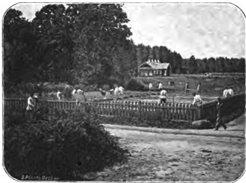
Рис. 13. Совмѣстныя работы больныхъ мужчинъ и женщинъ на огородѣ. (Моментальная фотографія А. Я.).

Никакого рогатаго скота лечебница въ своемъ хозяйствѣ, по вышеуказанной причинѣ, не имѣетъ. Все сѣ скотоводство ограничивается держаніемъ