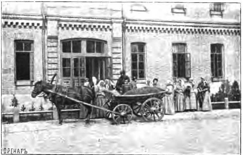
Рис. 11. Сборъ больныхъ женщинъ въ лѣсъ за грибами. (Моментальная фотография А. Я.).

характеръ, мы должны отмѣтить слѣдующія: игру въ городки въ весеннее время; общія прогулки въ лѣтние праздничные дни по нашимъ Кувшиновскимъ владѣнιάмъ. Идутъ обыкновенно большими партіями, съ гармониками и пѣніемъ. Иногда всѣмъ этимъ партіямъ устраивается въ одной изъ нашихъ рошъ общее чаепитіе, съ раздачей кое-какихъ гостинцевъ. Въ лѣтнее же время пропеходятъ у насъ и поѣздки за грибами, при чемъ идутъ за ними почти на цѣлый день, вая объѣдъ и чаевничая гдѣ-либо въ лѣсу или въ рошѣ. На праздникахъ Рождества Христова больнымъ устраивается елка, съ пѣніемъ, танцами и раздачей гостинцевъ. На масляной недѣлѣ бывасть 2 — 3 раза общія вечеринка съ пѣніемъ и танцами. Въ послѣднюю зиму у насъ былъ дважды организованъ спектакль, участниками кото-