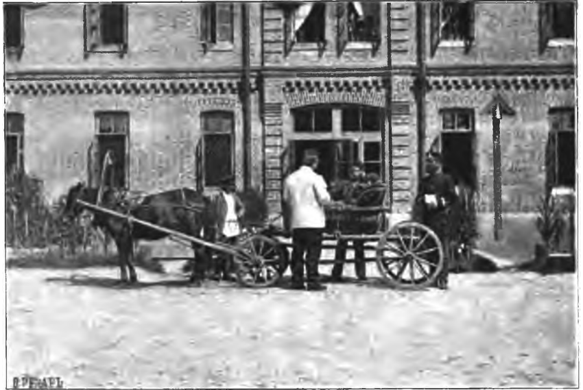
Рис. 18. Приемъ больной, доставленной изъ дальняго уѣзда. (Моментъ. фотогр. А. Яковлева).

Форма вопроснаго листа для собранія надлежащихъ свѣдѣній о больномъ нами приложена ниже (см. прил. стр. 158—160).