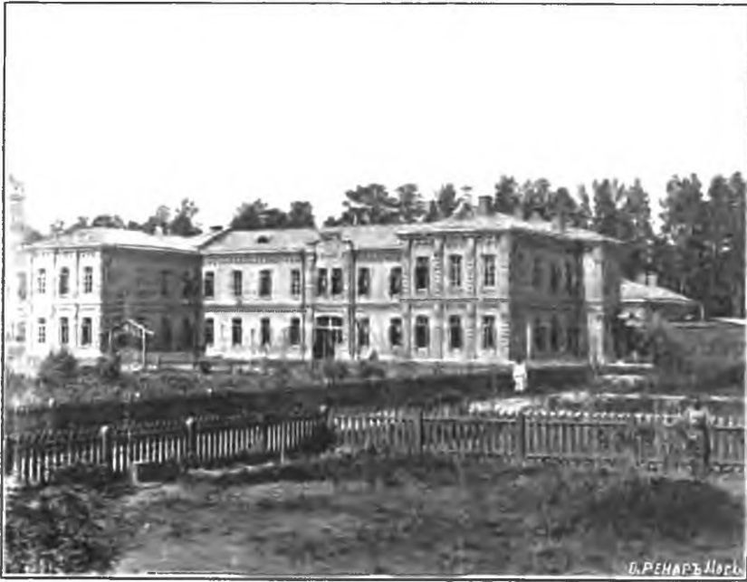
Рис. 2. Мужской каменный корпусъ.

Здание это построено по планамъ и сѣтамъ, утвержденнымъ Министерствомъ Внутреннихъ Дѣлъ и составленнымъ при участии, блаженной памяти, архитектора Штрома. Стиль здания фабричный. Форма постройки видна на прилагаемомъ ниже планѣ. (Смотри таб. 1 и 2): она имѣетъ, въ сущности, видъ двухъ буквъ П, стоящихъ другъ къ другу такъ, что ножки обѣихъ буквъ обращены въ прямо противоположныя стороны, а спинки буквъ связаны между собою промежуточнымъ, относительно узкимъ, звеномъ. Передняя буква П есть двухъэтажная часть постройки; заднее П, равно какъ и промежуточное звено—выстроены въ одинъ этажъ. Размѣры здания по наруж-