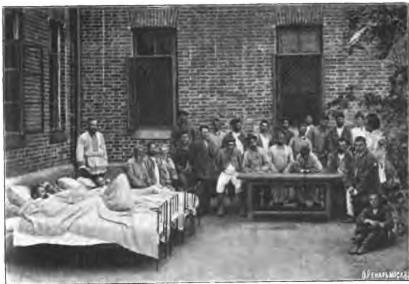
Рис. 7. Слабые и неопытные больные на открытомъ воздухѣ.

Въ этомъ дворикѣ вмѣсто обычныхъ деревянныхъ навѣсовъ при каменныхъ павильонахъ лечебницы, въ видѣ ошита, нами устроены небольшіе холщевые навѣсы надъ отдѣльными садовыми скамьями, оказавшіеся сооружениями значительно болѣе дешевыми по сравнению съ деревянными навѣсами каменныхъ павильоновъ и, вмѣстѣ съ тѣмъ, вполне удовлетворяющими своей цѣли предохранить больныхъ отъ солнечнаго зноя и отъ дождя. Заборы, огораживающіе всѣ означенныя мѣста для прогулокъ больныхъ, имѣютъ различное устройство, сообразно съ различными условіями характера тѣхъ больныхъ, для которыхъ предназначены эти огороженные мѣста; такъ,