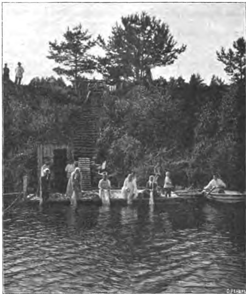
Рис. 15. Больныя прачки на портомойномъ плоту.

Приводить подробныя данныя продуктивности труда нашихъ больныхъ