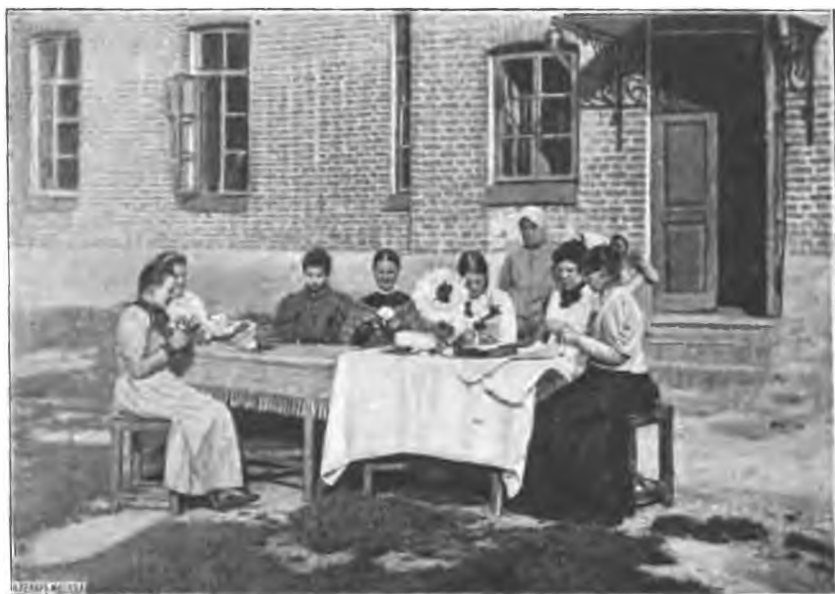
Рис. 17. 6 истеричекъ за работою бумажныхъ цвѣтовъ. (Момент. фотогр. А. Я.).

3) Врачъ, получивъ вышеуказанное заявленіе, немедленно осматриваетъ больного и собираетъ тутъ же, на мѣстѣ, отъ близкихъ къ нему лицъ свѣдѣнія по установленнымъ и напечатаннымъ на бланкахъ вопросамъ, отмѣчая эти свѣдѣнія на тѣхъ бланкахъ. Затѣмъ эти свѣдѣнія, вмѣстѣ съ своимъ