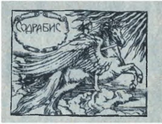
Ил. 1. Издательская марка «Содрабиса»

Несколько литографированных изданий – продукция Московского театрального издательства «Содрабис». Издательская марка его представлена на ил. 1. В нем, например, вышла книга «На чужой каравай рта не разевай: комедия в двух действиях для театра подростков» Эмиля Сувестра (Москва, 1923), стоящая на полке в нашей библиотеке.