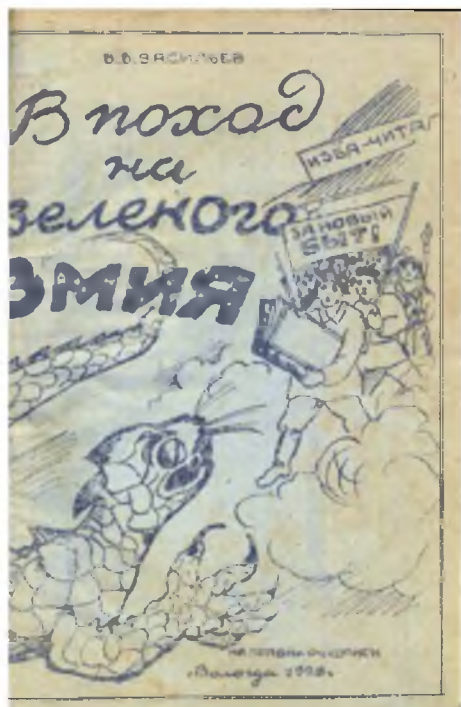
Ил. 4. Обложка книги «В поход на зеленого змия»

Гектограф давал до 100 оттисков (отсюда и его название), но только первые 30–50 были отчётливы. Мокрой губкой оттиск на массе смывается, и гектограф вновь годен к употреблению. За время существования гектографы были значительно усовершенствованы и использовались в малой (оперативной) полиграфии для быстрого размножения печатной продукции с невысокими требованиями к качеству оттисков. Для укрепления желатиновой массы в неё добавляли столярный клей. Используя разные сорта бумаги, впитывающей чернила по-разному, тираж с одной рукописи удавалось доводить до 200 экземпляров. Вначале оттиски делали на глянцевой бумаге, мало впитывающей чернила, при ослаблении качества оттиска брали более впитывающую бумагу. Способ гектографии изобретен М. И. Алисовым в 1869 г.