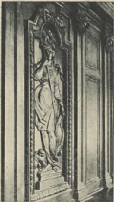
Мижерва. Резьба по дереву. •