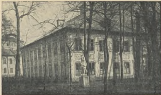
Дворец Петра I в Летнем саду.