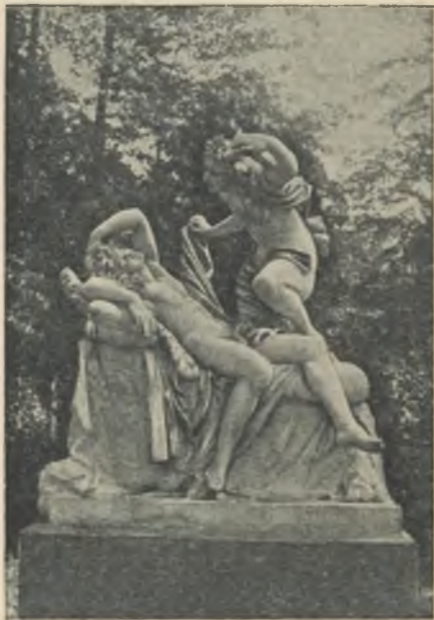
Амур и Психея.