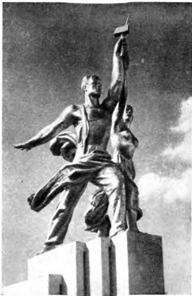
Рабочий и колхозница