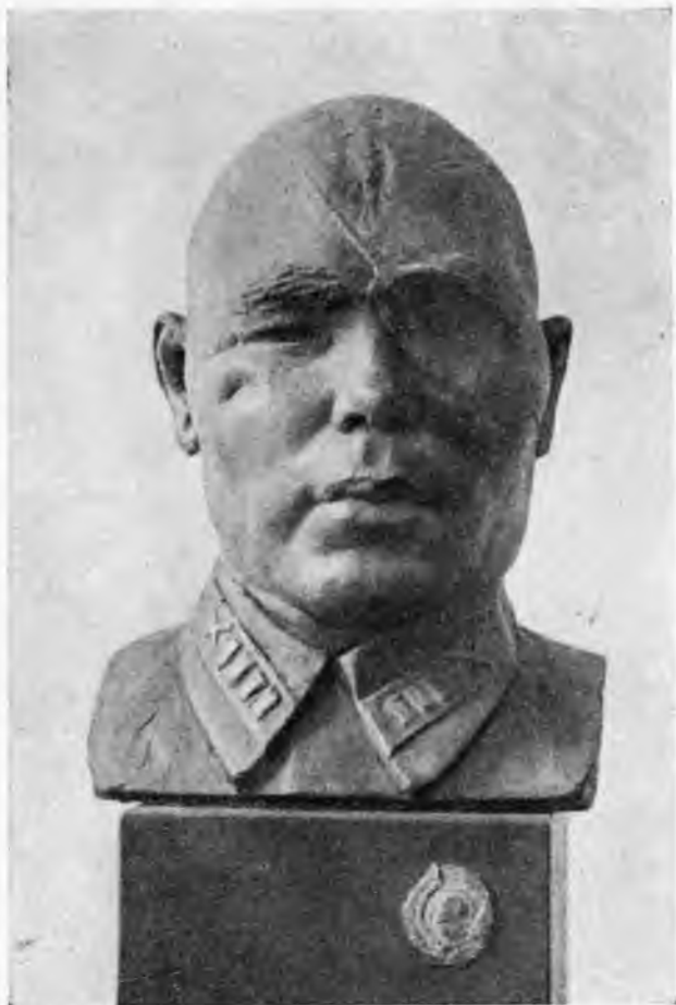
Портрет полковника И. А. Юсупова