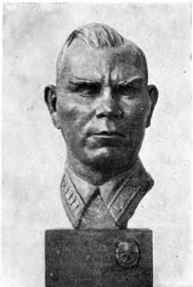
Портрет полковника Б. А. Хижняка