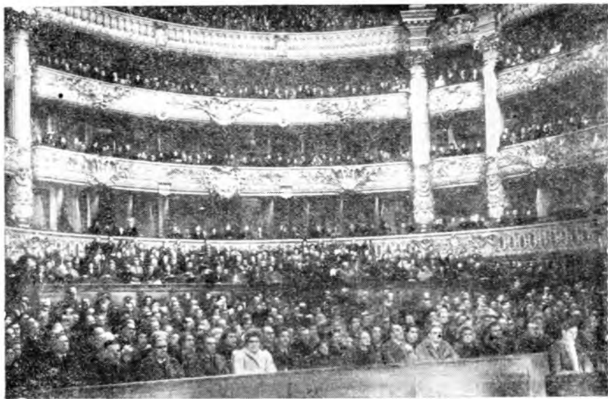
Общий вид профсоюзного собрания в Оперном театре в Париже.