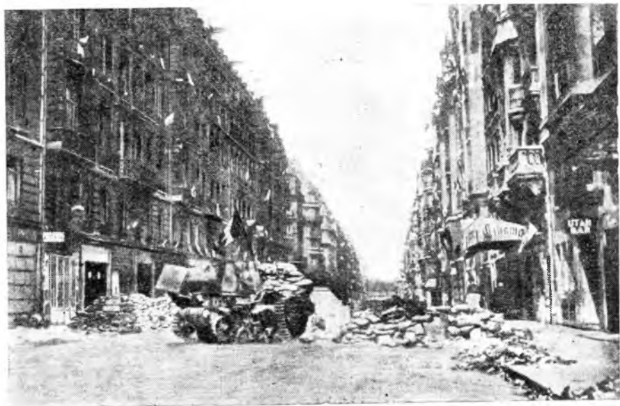
Партизаны овладели немецким танком на улице Courcelles (Париж).