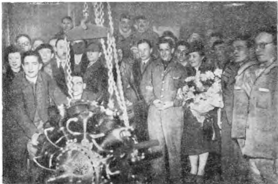
Советская профсоюзная делегация на авиамоторостроительном заводе «Гном и Рон» в Париже.