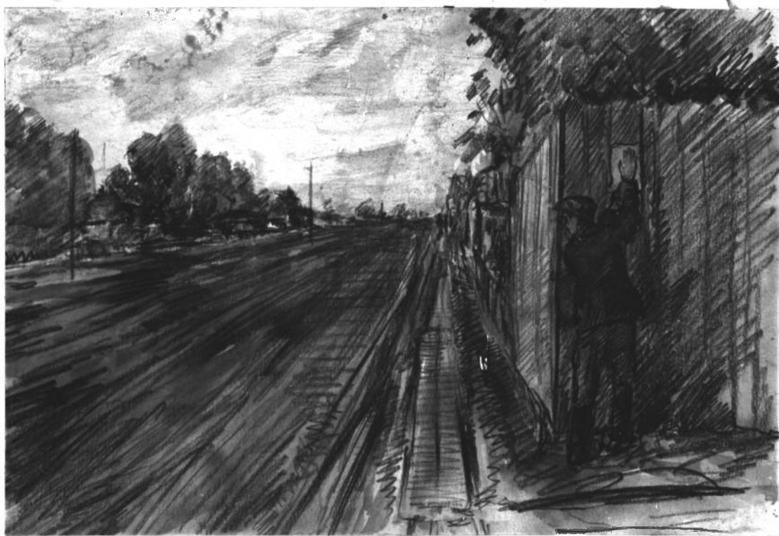
Н. Островский расклеивает прокламации подпольного комитета партии большевиков, призывающие народ к борьбе с немецкими оккупантами, грабившими Украину в 1918 году.