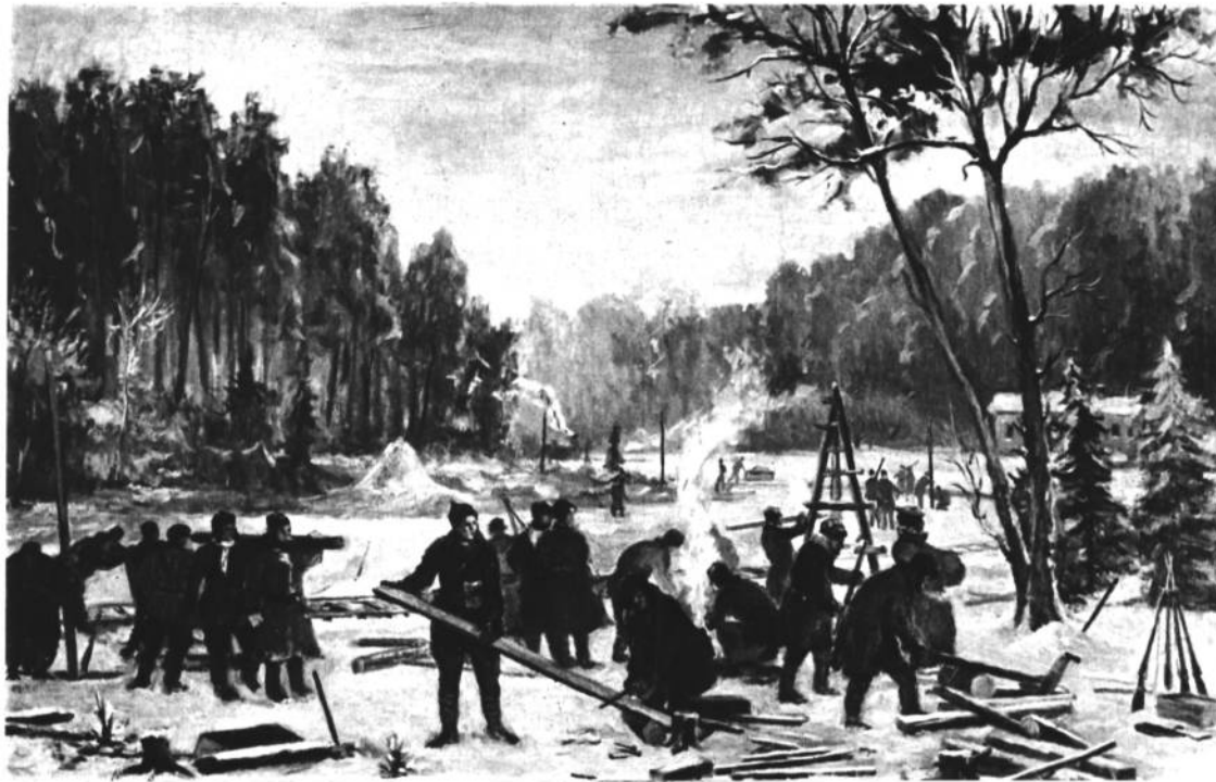
Н. ОСТРОВСКИЙ НА СТРОЙКЕ УЗКОКОЛЕЙКИ Художник Фурман