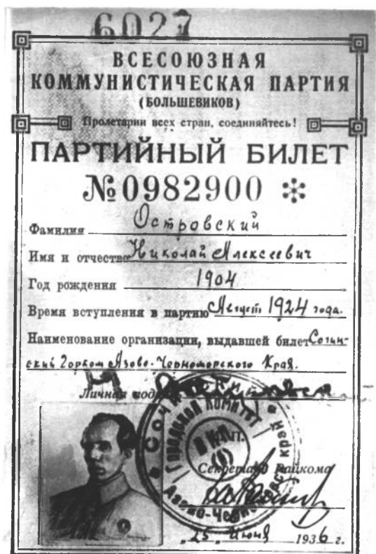
ПАРТИЙНЫЙ БИЛЕТ Н. ОСТРОВСКОГО

Я — маленькая дождевая капля, в которой отобразилось солнце партии.