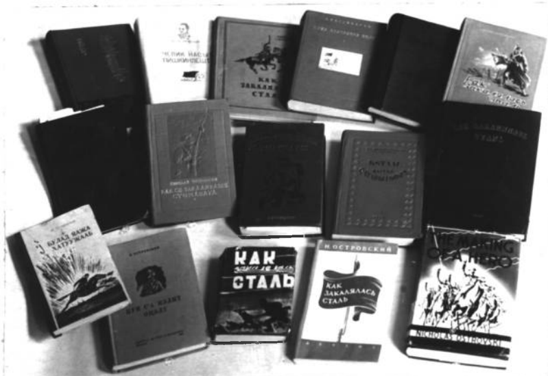
ФОТОМОНТАЖ ИЗДАНИЙ КНИГИ «КАК ЗАКАЛЯЛАСЬ СТАЛЬ»

М. И. Калинин — Речь на собрании слушателей и профессорско-преподавательского состава Военно-политической академии Красной Армии имени Ленина 19 сентября 1940 г.