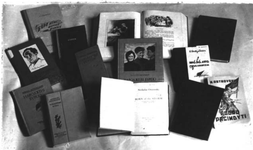
ФОТОМОНТАЖ ИЗДАНИИ КНИГИ «РОЖДЕННЫЕ БУРЕЙ»

Н. Островский — Из отчета на президиуме Союза советских писателей.