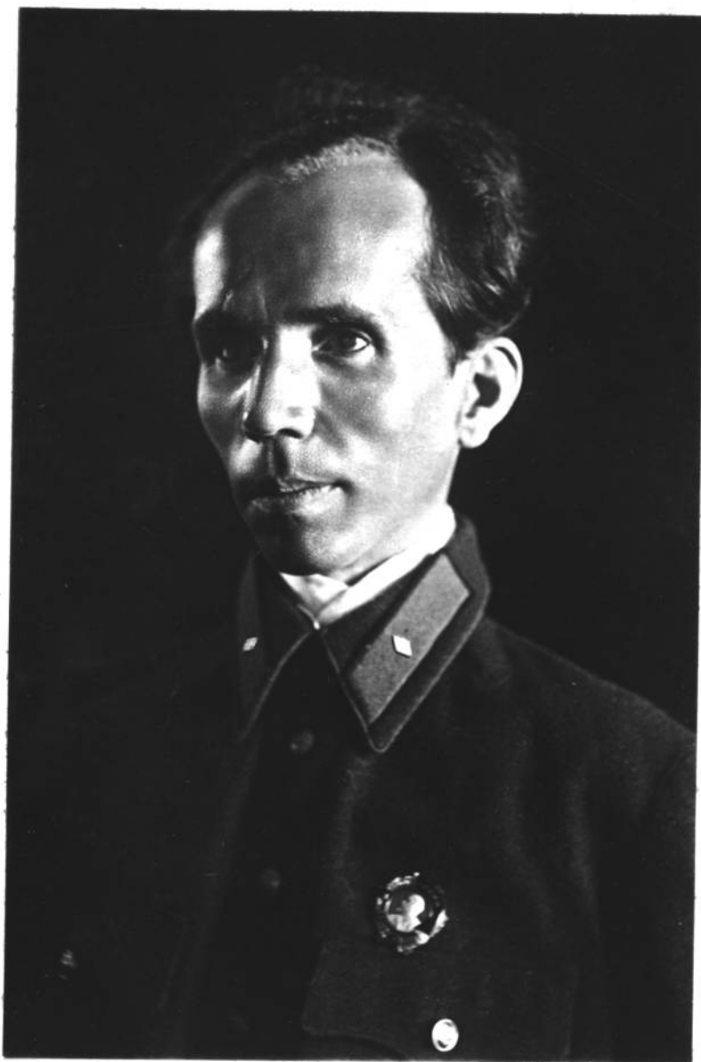
Н. ОСТРОВСКИЙ. 1936 г.

Вы, наверное, единственный бригадный комиссар, который не сможет сказать, сколько у него в бригаде бойцов, но Вы верно чувствуете сердцем, какая это огромная бригада—ведь это целая комсомолка, вся молодежь нашей необъятной страны, да и не только нашей страны!