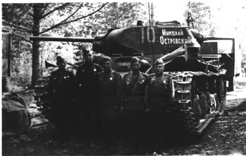
ТАНК ИМЕНИ Н. ОСТРОВСКОГО

Н. Островский — Из выступления по радио на IX Всеукраинском съезде ЛКСМУ 6 апреля 1936 г.