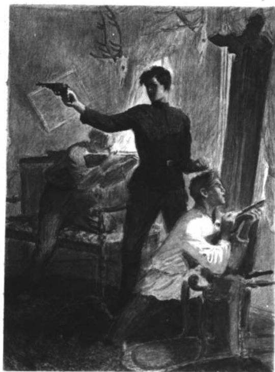
В ОСАДЕ С иллюстрации художника Чурабо

— Эй, там в доме, сдаетесь? — Пошел к чорту, гад! Будем биться до последнего! Да здравствует коммуна! — крикнул Андрий.