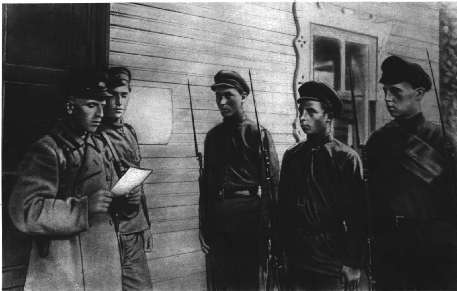
КОМСОМОЛЬЦЫ СЛУШАЮТ ПРИКАЗ О НАСТУПЛЕНИИ. 1920 год.

Вместе с комсомольским билетом мы получали ружье и двести патронов. Неувядаемой славой покрыли себя первые комсомольцы, верные помощники партии.