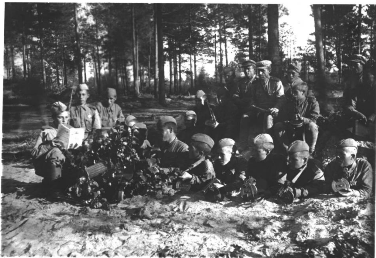
БОЙЦЫ БРЯНСКОГО ФРОНТА ЧИТАЮТ КНИГУ «КАК ЗАКАЛЯЛАСЬ СТАЛЬ» Сентябрь 1943 г.

Из письма бойцов Н-ской части Р. П. Островской. 1942 г.