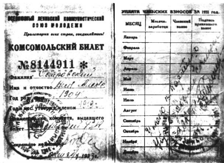
КОМСОМОЛЬСКИЙ БИЛЕТ Н. ОСТРОВСКОГО

Н. Островский — Из письма к товарищу Сталину