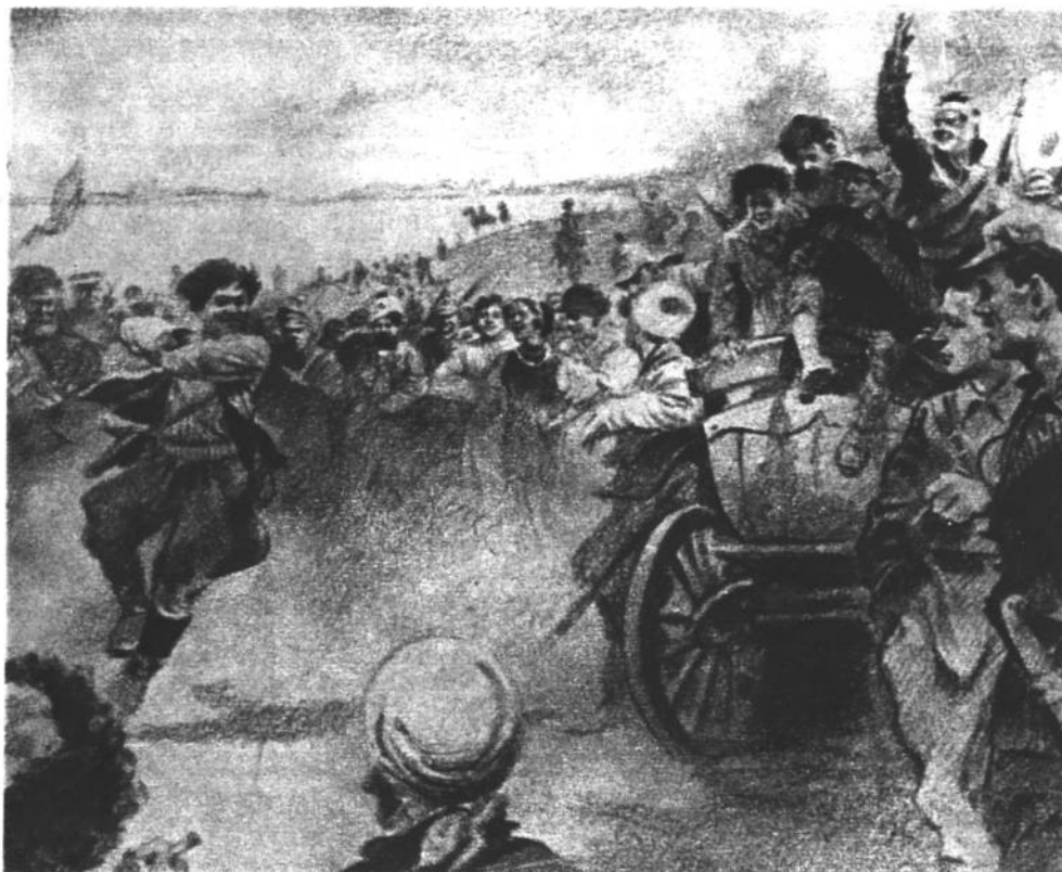
ПАВЕЛ — ГАРМОНИСТ С иллюстрации художника Резниченко