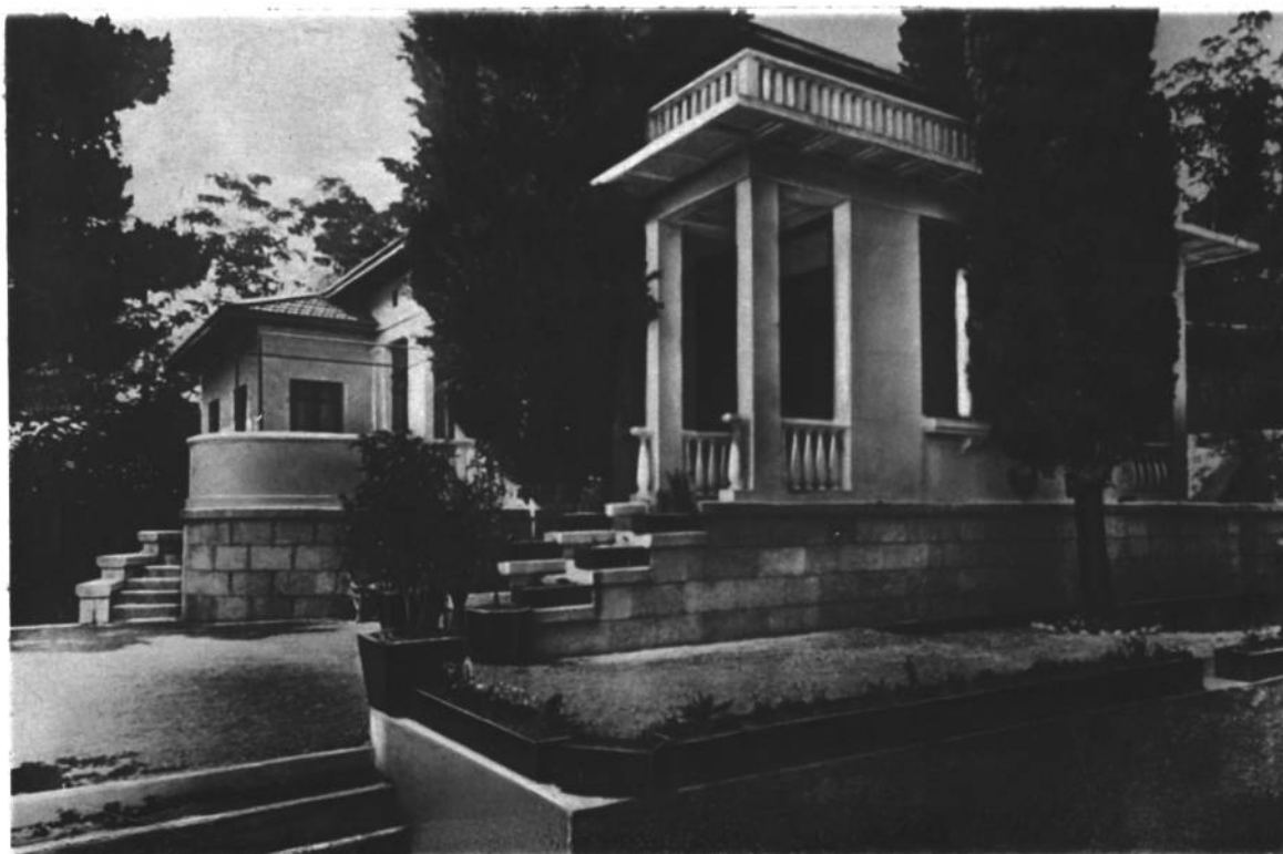
ДОМ В СОЧИ, ВЫСТРОЕННЫЙ ПРАВИТЕЛЬСТВОМ УКРАИНЫ ДЛЯ Н. ОСТРОВСКОГО

Опубликовано в газете «Правда» 2 октября 1935 г.