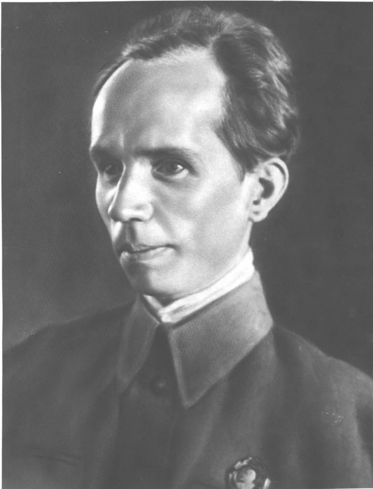
Н. А. Островский