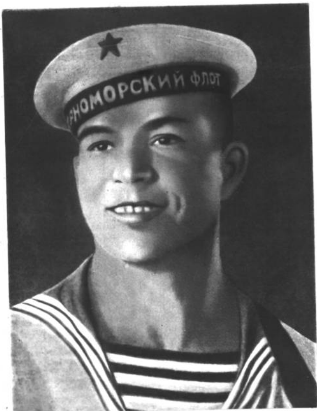
ГЕРОЙ СОВЕТСКОГО СОЮЗА ГВАРДИИ СТАРШИНА 1-й СТАТЬИ ГРИГОРИЙ КУ- РОПЯТНИКОВ ИЗ КОМАНДЫ ГЕРОИ- ЧЕСКОГО КАТЕРА «СК-065».

Герой Советского Союза гвардии старшина 1-й статьи Г. Куропятников