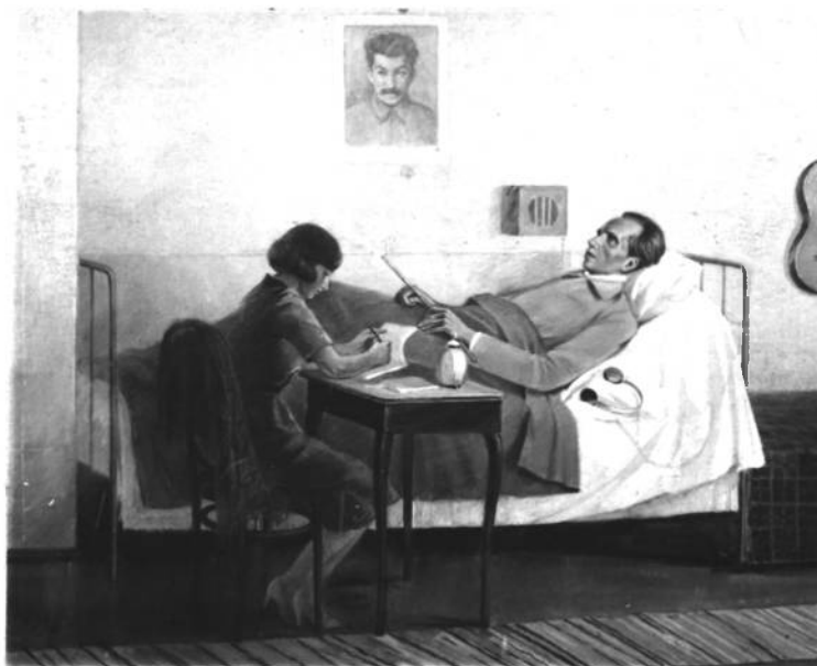
Н. ОСТРОВСКИЙ ДИКТУЕТ ПЕРВУЮ ЧАСТЬ РОМАНА «КАК ЗАКАЛЯЛАСЬ СТАЛЬ»