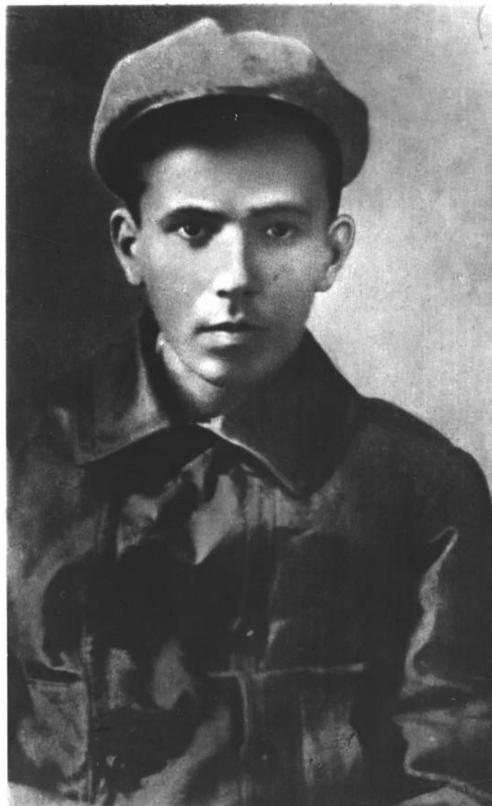
Н. ОСТРОВСКИЙ. 1922 г.