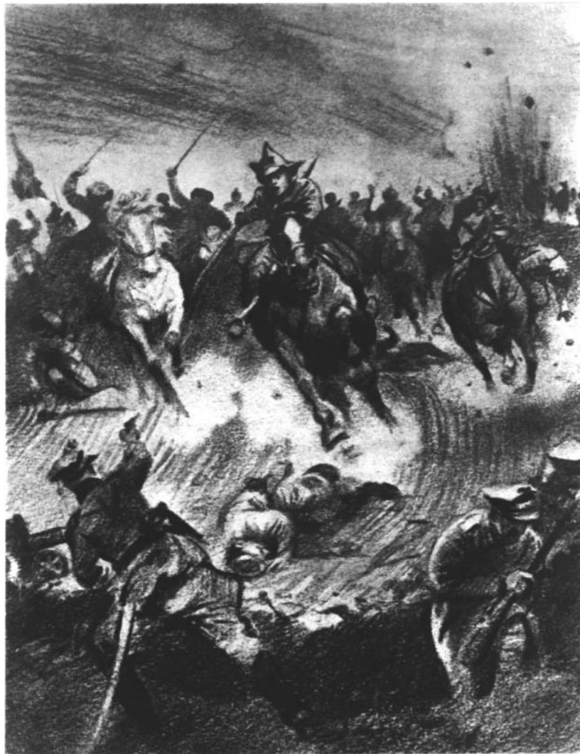
ПАВЕЛ КОРЧАГИН В БОЮ С иллюстрации художника Резниченко