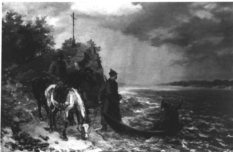
Н. ОСТРОВСКИЙ — БОЕЦ ДИВИЗИИ КОТОВСКОГО В РАЗВЕДКЕ Художник Я. Д. Ромас

Мы своими глазами видели всю подлость и жестокость врага. Мы учились ненавидеть. Наши сердца закалялись в этой кровавой борьбе. И когда, вступая в освобожденные города, мы видели виселицы с телами замученных товарищей, то наши сабли разили еще беспощадней.