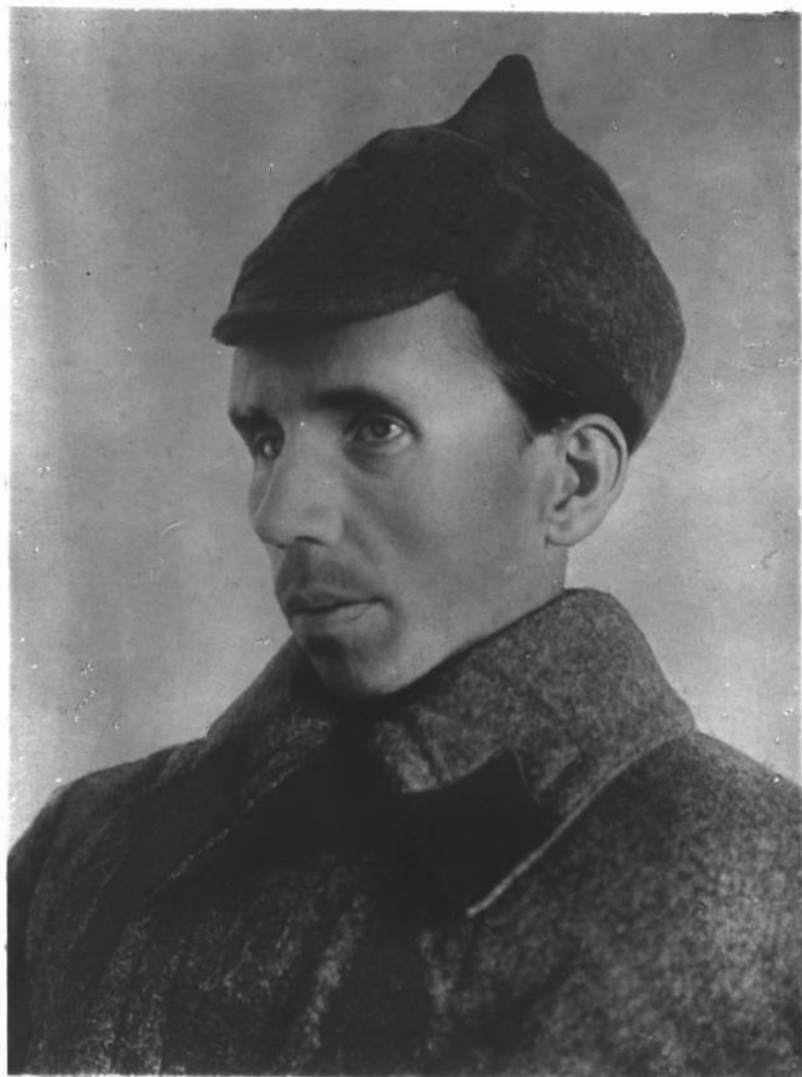
Н. ОСТРОВСКИЙ. 1935 г.