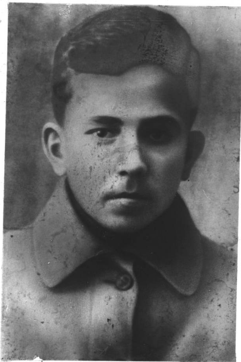
Н. ОСТРОВСКИЙ. 1918 г.