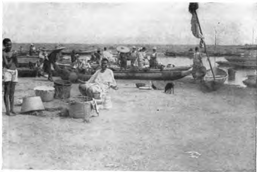
В ожидании рыбаков с уловом

Путь преграждает шлагбаум. Пограничная застава. Контрольные пункты со стороны Того и Дагомеи. Граница здесь понятие очень условное. Проверка паспортов проводится только на основных автотранспортных путях. Для местных жителей переход из одного государства в другое трудности не представляет.