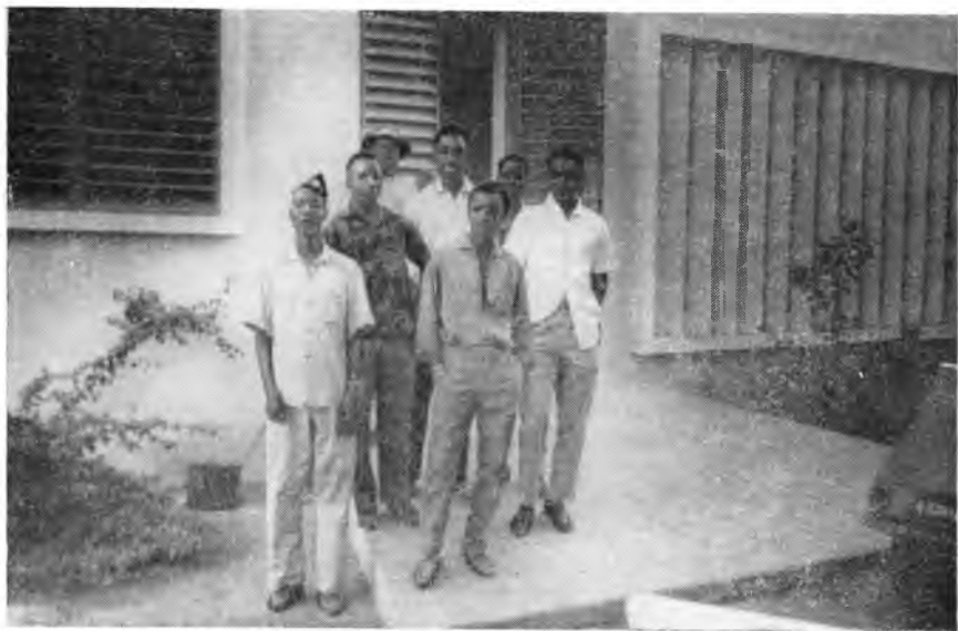
Студенты сельскохозяйственной школы

Вынужденные предоставить Верхней Вольте воз-