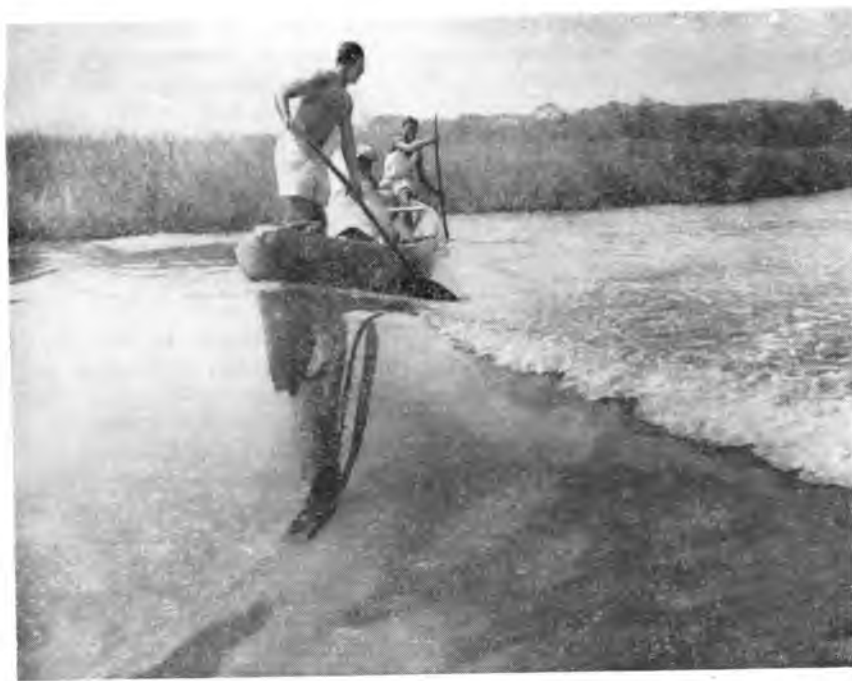
На рыбной ловле