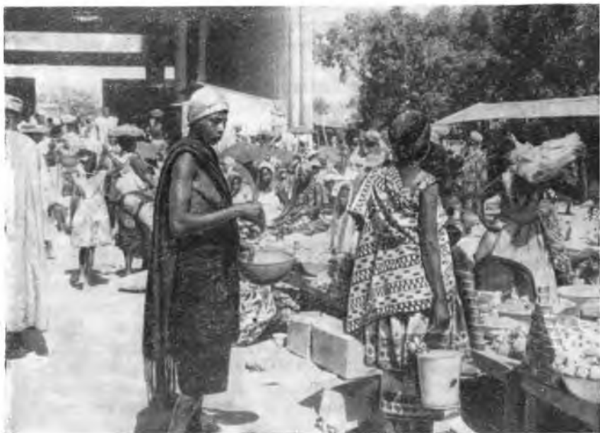
Ярмарка в Ниамее

собралось не менее ста тысяч тружеников, приехавших из разных мест страны.