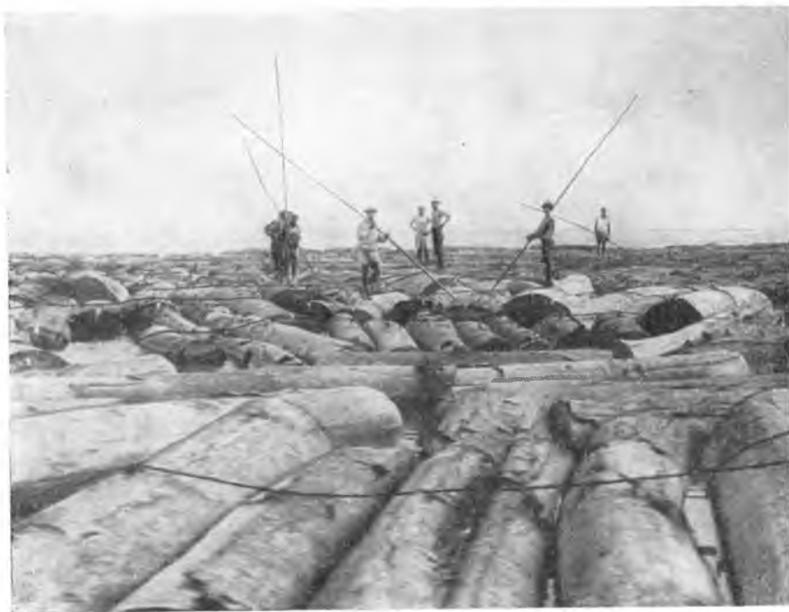
Сплав леса в устье реки Габон

В трудных условиях, в сложной политической об-