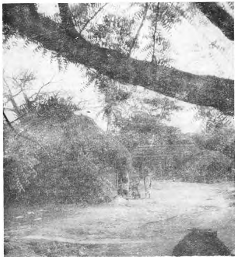
Деревня в Того