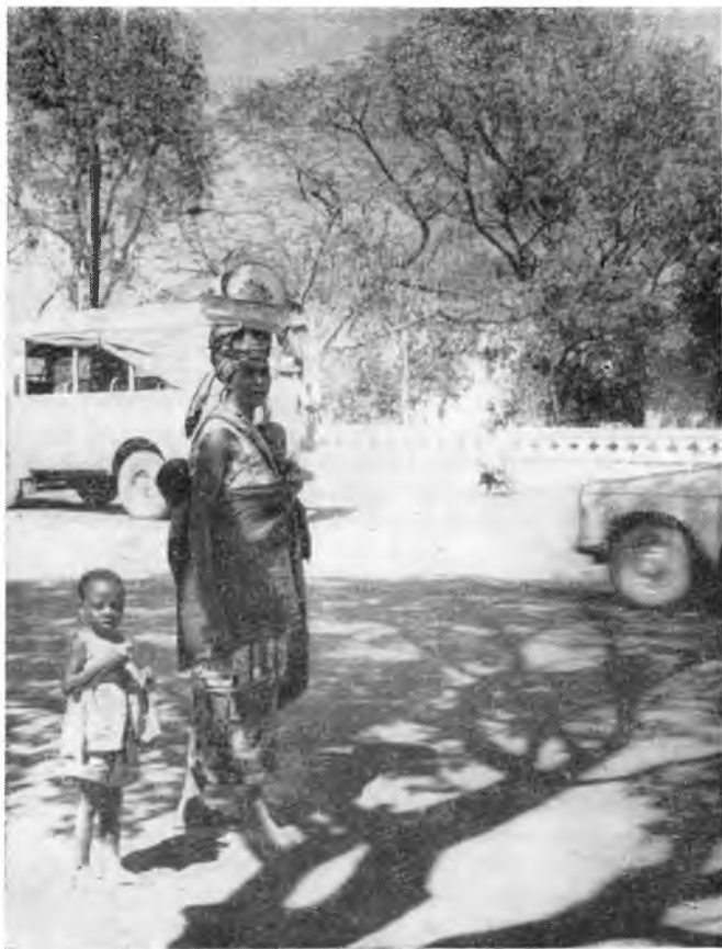
Тоголезская женщина с детьми