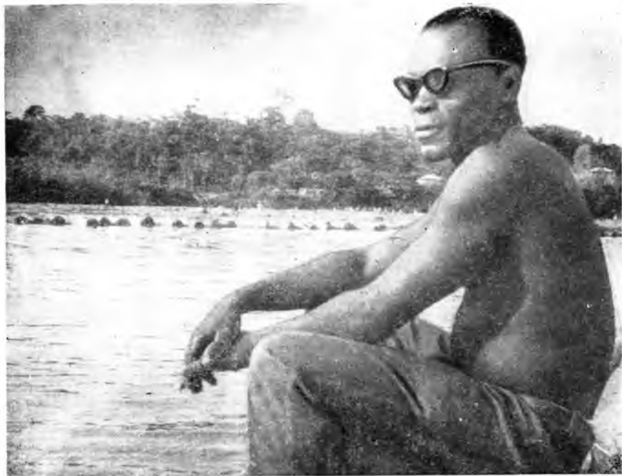
Техник сплава на реке Габон

западногерманских и итальянских монополистов. Разработка железной, марганцевой, урановой руд, а также месторождений золота и алмазов сулит им баснословные прибыли. Формальная независимость страны и республиканский образ правления не препятствуют