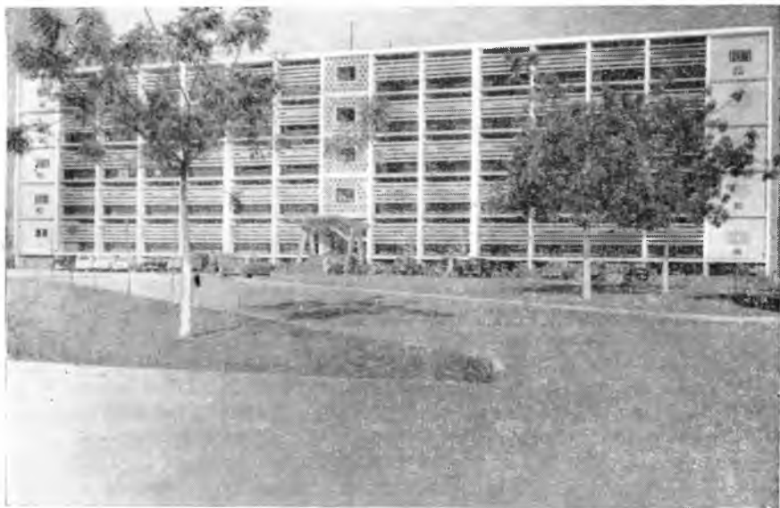
Здание правительства в столице Верхней Вольты — Уагадугу

местных служащих, составляющих «средний» класс. Недавно построены три небольших правительственных здания. Они резко выделяются современным легким стилем, соответствующим жаркому климату и запросам руководящего страной аппарата. Окраины же мало чем отличаются от глубоких захолустий — такие же прижатые к земле глинобитные хижины без окон, покрытые пальмовыми ветвями.