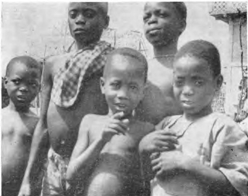
Юные жители Гамбии

Катер, лавируя по улицам, выходил на простор лагуны. Все облегченно вздохнули и поторопились сде-