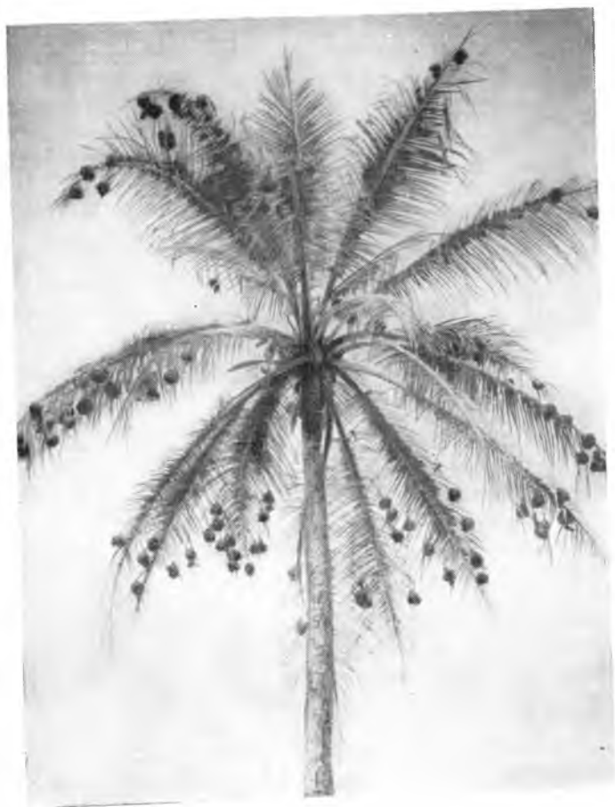
Гнёзда колибри на масличной пальме