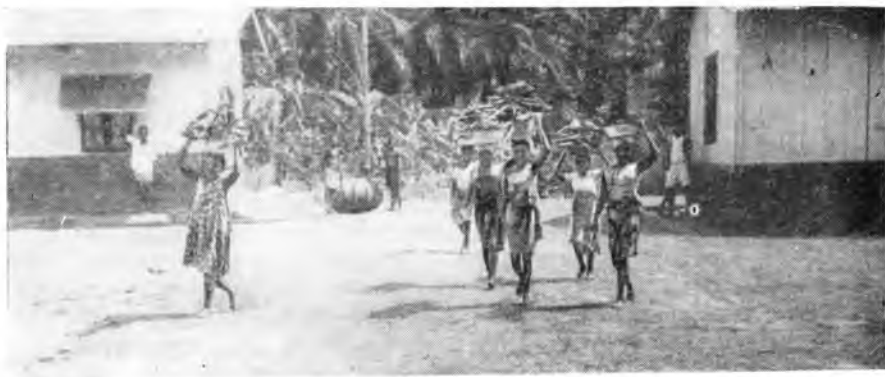
С дровами из джунглей

— О, это голова! Олимпио правильно делает, мы его любим. Земля наша богата, французы обирали ее