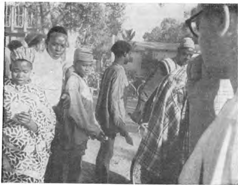
Молодежь знакомится с условиями приема в Университет дружбы народов

— Вы русские... — повторил Зирим взволнованно. —