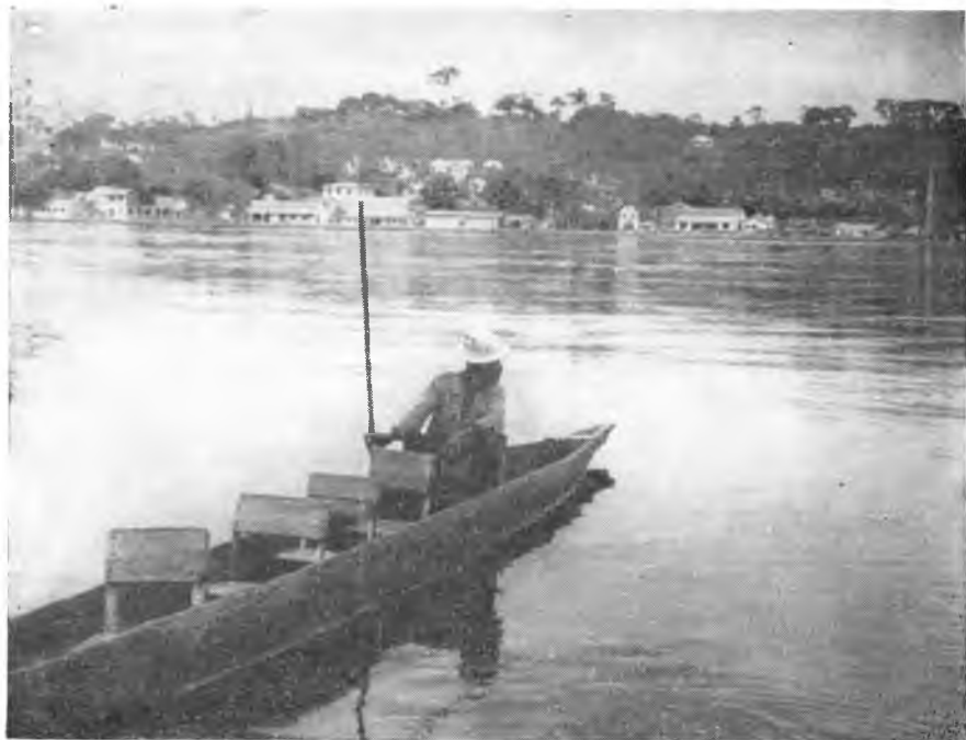
Селение Ламбарене, где расположен госпиталь Швейцера

цепями привязаны мартышки. Забавно было наблюдать, как, догнав своих поводырей, мартышки ловко вскакивали на спины собак и верхом разъезжали по саду и узким улочкам больничного городка.