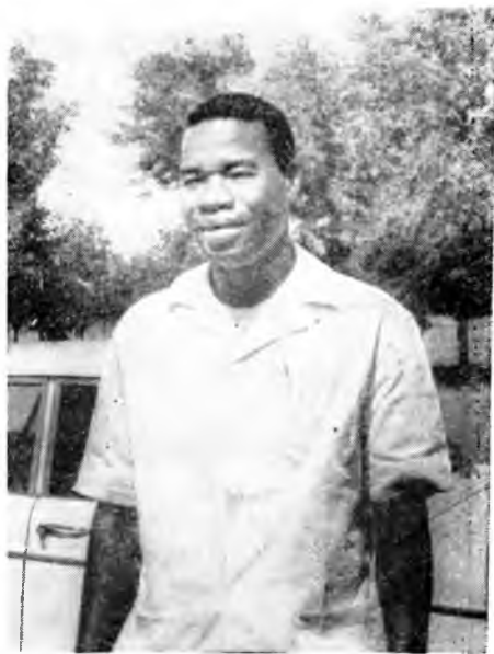
Управитель округа Комбисира — Зириим Киборе