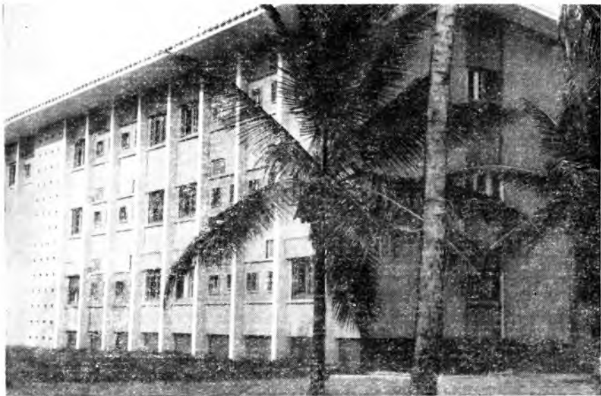
Дом французских колонизаторов в Либревиле

Вечерами господа колонизаторы и их поверенные съезжаются на автомашинах в гостиницу. В салонах они неторопливо пьют виски и бургундское, наслажда-