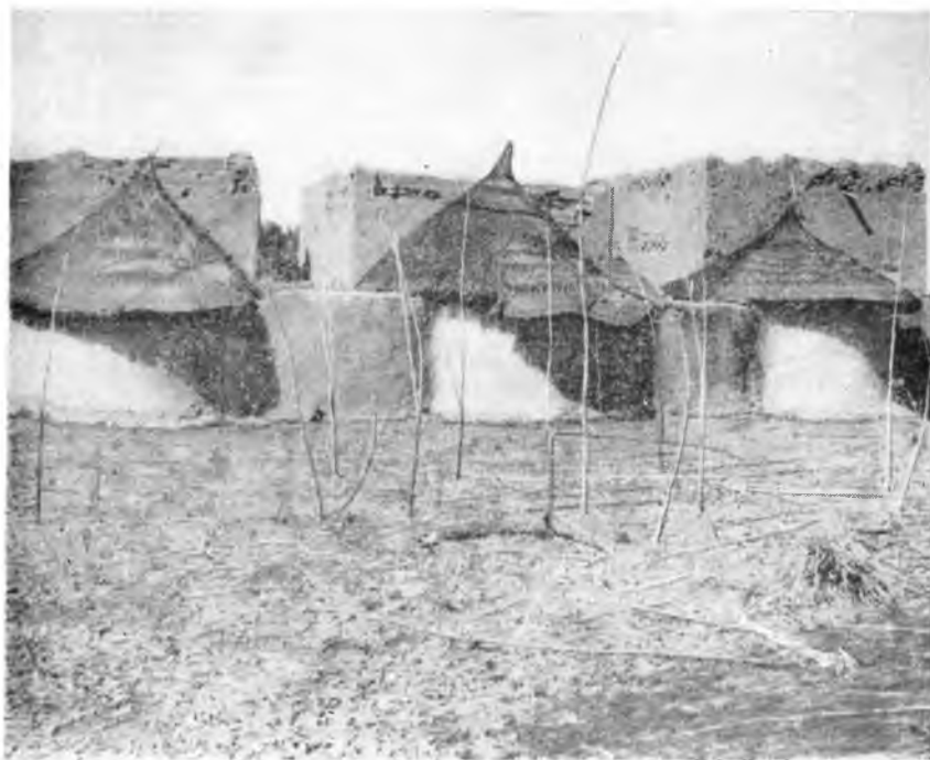
Хижины жителей Верхней Волты