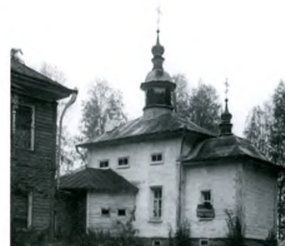
▲ Иоанно-Предтеченский скит. XIX век Small hermitage of St. John the Baptist. 19 th century

It was closed in 1924. The buildings of the small Assumption hermitage were dismantled, and the hermitage of St. John the Baptist burned down in 1946. Nowadays the Nilo-Sorsky hermitage represents an architectural ensemble of the mid 19 th – beginning of the 20 th centuries. The walls with the church of the Intercession of the Virgin, corner towers and the archbishop's house have come down to us. The surviving part of the church property was handed over to the museum in 1920-s and 1930-s. In the Kirillo-Belozersky museum-reserve there is a hair-shirt made of camel's hair and a rosary which according to the legend belonged to St. Nil Sorsky, icons, books, some part of the church plate.