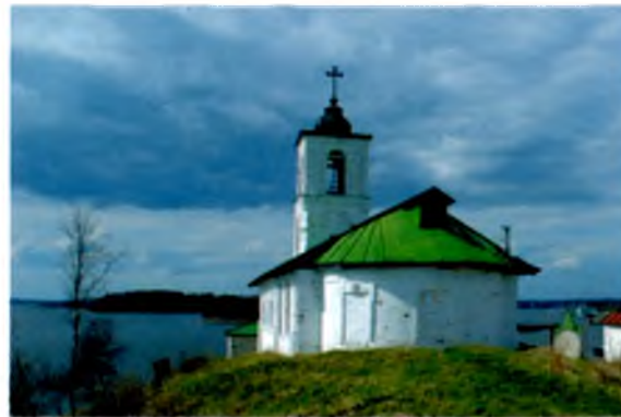
▼ Церковь Введения Church of the Presentation of the Virgin to the temple