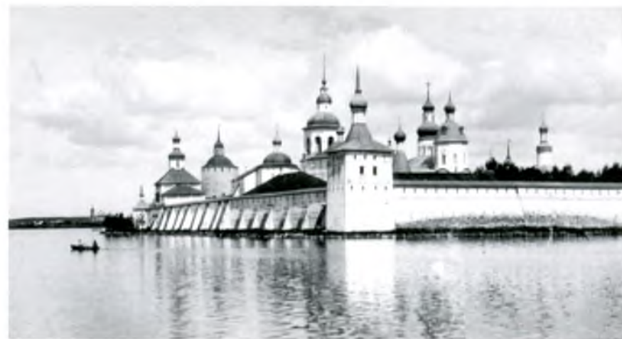
▲ Кирилло-Белозерский монастырь. Вид с Сиверского озера. Почтовая открытка. Начало XX века Kirillo-Belozersky monastery. View from Lake Siverskoye. Postcard. Early 20 th century

One of the most famous centers of the Northern Thebaid is the Kirillo-Belozersky monastery situated on the shore of Lake Siverskoye and almost in the center of Kirillov. The Kirillo-Belozersky monastery is the largest religious, cultural and economic centre of the Russian North. Many founders of Northern monasteries took the vows there. Among them: St. Sabbatius, founder of the famous Solovetsky monastery and St. Martinian, Ferapont's successor and organizer of the Ferapontov monastery, who were made monks by St. Kirill himself, and later on St. Nil Sorsky, St. Cornily Komelskiy, St. Alexander Oshevskiy, St. Ignaty Lomskiy. During the lifetime of Kirill books were copied in the monastery and there was a school where young men were taught grammar. Three centuries ago the church hymns of Kirillov were taken and spread as a model of sacred music. A number of icons from the Kirillo-Belozersky monastery were attributed to Andrei Rubliov, Daniel Cherny and Dionisy. By the end of the 17th century the monastery had possessed a big library which was known as the richest library of Russia containing about 2 thousand books.