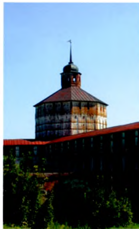
▲ Кирилло-Белозерский монастырь. Вологодская башня. XVII век Kirillo-Belozersky monastery. Vologda Tower. 17 th century