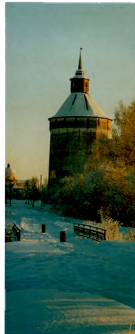
▲ Кирилло-Белозерский монастырь. Московская башня. XVII век Kirillo-Belozersky monastery. Moscow Tower. 17 th century