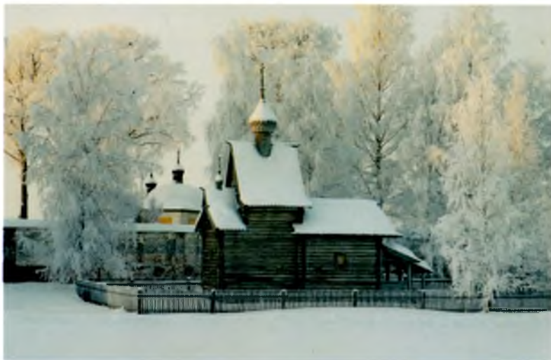
▲ Церковь Ризоположения из с. Бородава. 1485 Church of the Deposition of the Robe from the village Borodava. 1485

В Новом городе с 1958 года сохраняется церковь Ризоположения (1485 г.) из села Бородава – древнейшее деревянное сооружение Севера. Рядом с ней – ветряная мельница XIX века, перевезенная, вероятно, из деревни Горка. В XIX веке таких мельниц в Кирилловском уезде было великое множество, сейчас сохранилась только одна.