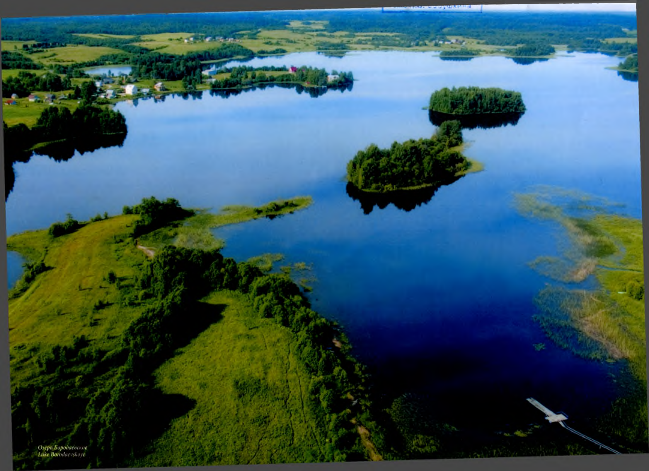
Озеро Бородавское Lake Borodavskoye