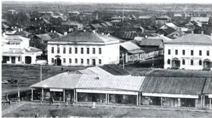
▲ г. Кириллов, Торговые ряды, Почтовая открытка. Начало XX века Kirillov, Trading rows. Postcard. Early 20 th century

Город Кириллов является в настоящее время административным центром Кирилловского района Вологодской области. Он находится в 130 км от областного центра – г. Вологды и в 7 км от Волго-Балтийского водного пути. Кириллов нередко называют туристическими воротами Вологодской области. Город с населением около 8 тысяч человек ежегодно принимает до четверти миллиона туристов. Мировую славу городу Кириллову и Кирилловскому району принесли архитектурные ансамбли Кирилло-Белозерского и Ферапонтова монастырей и фрески Дионисия.