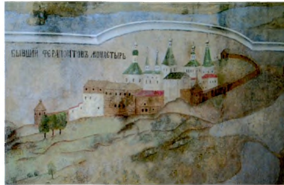
▲ Ферапонтов монастырь. Роспись вестибюля Архимандричьих келий Кирилло-Белозерского монастыря. 1838-1840-е гг. Ferapontov monastery. Wall-painting in the hall of the Father Superior's house in the Kirillo-Belozersky monastery. 1838-1840-s

Ферапонтов монастырь. Святые врата Ferapontov monastery. Holy Gates