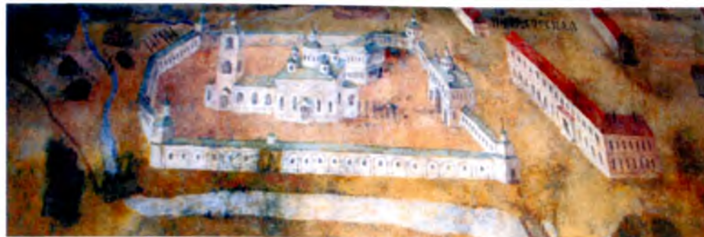
◀ Нило-Сорская пустынь. Роспись вестибюля Архимандричьих келий Кирилло-Белозерского монастыря. 1838-1840-е гг.

Обитель была закрыта в 1924 году. Постройки Успенского скита разобрали, а Иоанно-Предтеченский скит сгорел в 1946 г. В настоящее время Нило-Сорская пустынь представляет собой архитектурный ансамбль середины XIX – начала XX веков. Хорошо сохранилась монастырская ограда с церковью Покрова Богородицы и угловыми башнями, архиерейский дом. Сохранилась и часть церковного имущества, переданная в 1920-е и 1930-е годы в музей. В Кирилло-Белозерском музее-заповеднике хранятся власяница и четки из верблюжьей шерсти, по преданию, принадлежавшие Нилу Сорскому, иконы, книги, часть церковной утвари.