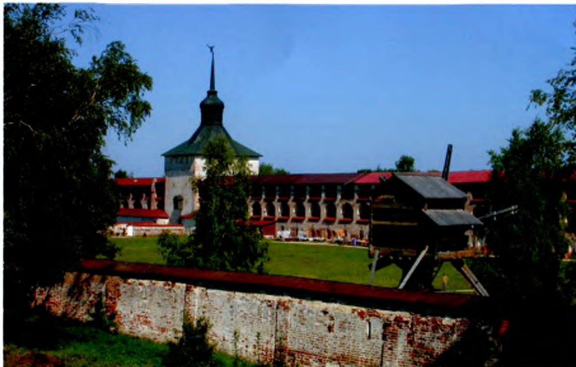
▲ Кирилло-Белозерский монастырь Kirillo-Belozersky monastery

The wooden church of the Deposition of the Robe (1485) from the village Borodava, the most ancient wooden construction of the North, has been preserved on the territory of the New Town since 1958. Near it there is a windmill of the 19 th century, which was probably transported from the village Gorka. In the 19 th century there was a large number of similar windmills in the Kirillov district, but only one has come down to us.