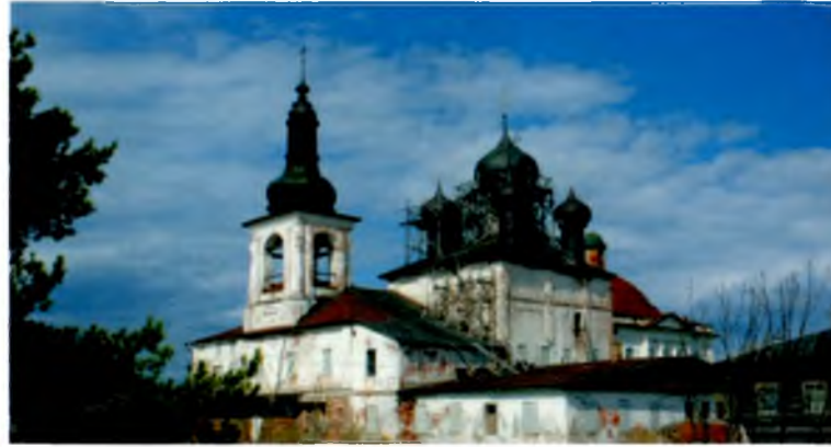
▲ Колокольня. Воскресенский собор Bell-tower. Resurrection cathedral

Горицкий женский монастырь – одна из самых выдающихся женских обителей на Руси. Здесь отбывали ссылку две жены Ивана Грозного – Анна Колтовская (старица-царица Дарья) и Мария Нагая, мать царевича Дмитрия. В начале XVII века – дочь Бориса Годунова (царевна Ксения) и княгиня М.Н. Черкасская с племянником Михаилом, будущим царем – основоположником династии Романовых и, возможно, его мать – инокиня Марфа (И.И. Милославская). С 1739 по 1741 годы в стенах монастыря жила Е.А. Долгорукова – невеста Петра II, сосланная впоследствии в Березов.