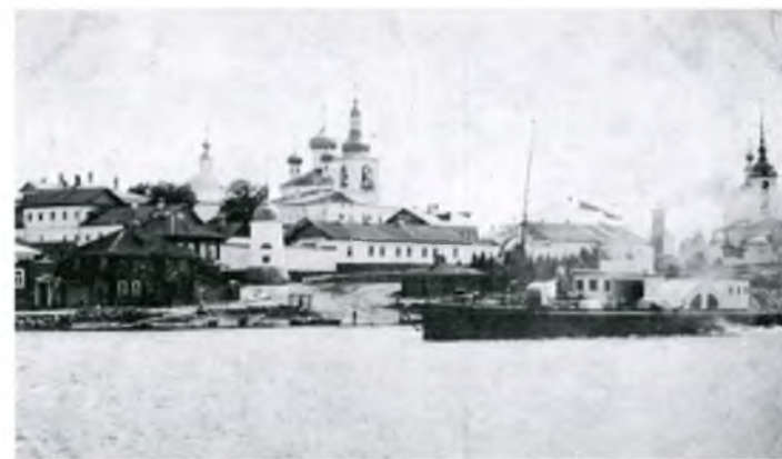
▲ Горицкий женский монастырь. Почтовая открытка. Начало XX в. ▼ Goritsky convent. Postcard. Early 20 th century

Near the convent walls there was a small settlement where the parish clergy and watchmen lived, and there was a ferry across the Sheksna River there.