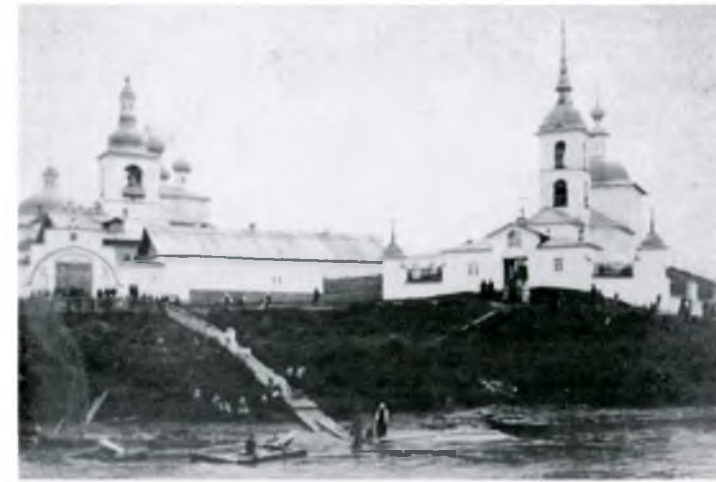
◆ Горицкий женский монастырь. Почтовая открытка. Начало XX века Goritsky convent. Postcard. Early 20 th century