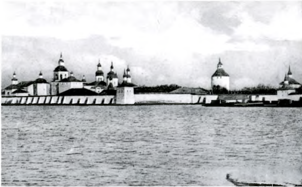
▲ Кирилло-Белозерский монастырь. Почтовая открытка. Начало XX века Kirillo-Belozersky monastery. Postcard. Early 20 th century

К концу XVI века деревянные укрепления Ивановского и Успенского монастырей заменили на каменные. В систему монастырских укреплений, кроме стен и башен, вошли две надвратные церкви: Преображения и Иоанна Лествичника. Высота стен первоначально достигала 5,5 метра. Во время польско-литовского нашествия Кирилло-Белозерский монастырь оказал ожесточенное сопротивление неприятелю. Более шести лет монастырь находился под угрозой нападения и был отрезан от своих вотчин.