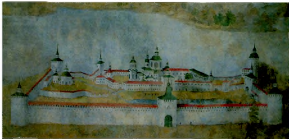
▲ Кирилло-Белозерский монастырь. Роспись вестибюля Архимандричьих келий. 1838-1840-е гг. Kirillo-Belozersky monastery. Wall-painting in the hall of the Father Superior's house. 1838-1840-s

Грандиозный ансамбль Кирилло-Белозерского монастыря сформировался в основном за два столетия – с конца XV до конца XVII века. Это самый большой монастырский комплекс России, его площадь около 12 га. За простирающимися почти на 2 км фундаментальными монастырскими стенами находится одиннадцать больших и малых церквей. Исторически сложившаяся структура обители включает в себя Большой Успенский, Малый Ивановский монастыри и Новый город.