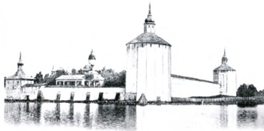
▲ Кирилло-Белозерский монастырь. Почтовая открытка. Начало XX века Kirillo-Belozersky monastery. Postcard. Early 20 th century

The grandiose ensemble of the Kirillo-Belozersky monastery was built mainly during two centuries – from the end of the 15 th century till the end of the 17 th century. It is the largest monastery of Russia, its territory is about 12 hectares. Behind its solid walls which are 2 kilometers long, there are eleven big and small churches. The monastery consists of the Big Assumption, the Small Ivanovsky monasteries and the New Town.