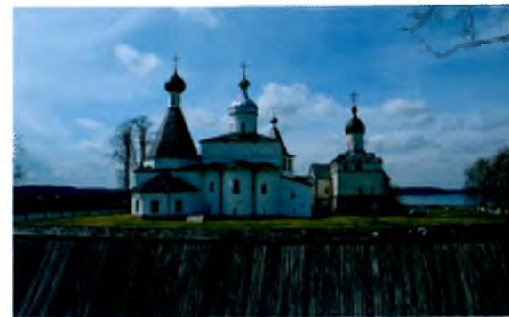
▲ Феропонтов монастырь ▼ Ferapontov monastery

In the 19 th century when there was a parish there, the territory of the monastery was surrounded with a stone wall.