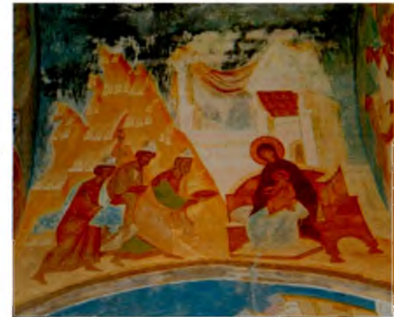
◀ ◀ ▲ Ферапонтов монастырь. Стенописи в соборе Рождества Богородицы. Дионисий. 1502 Ferapontov monastery. Dionisy's frescoes in the Church of the Nativity of the Virgin. 1502