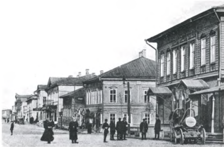
▲ г. Кириллов, ул. Гостинодворская, Почтовая открытка. Начало XX века Kirillov, Gostinodvorskaya Street. Postcard. Early 20 th century