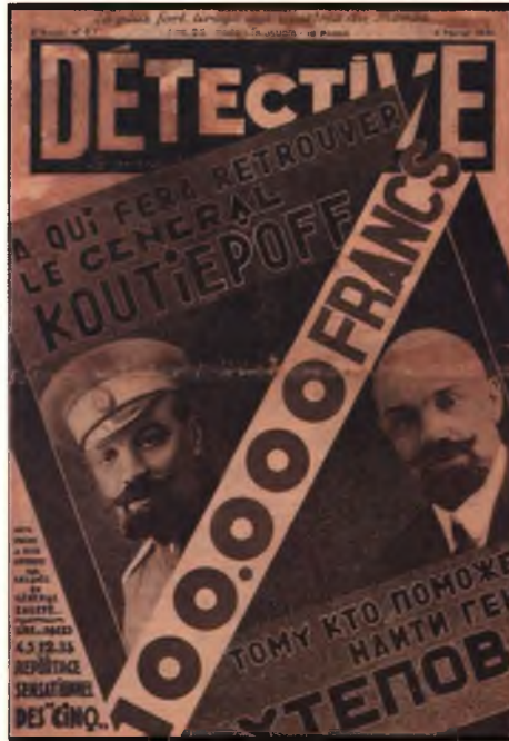
Обложка французского журнала «Детектив». 100 000 франков (за такие деньги в Париже можно было купить хороший отель) — такое вознаграждение неофициально предложил РОВС за помощь в розыске Кутепова.