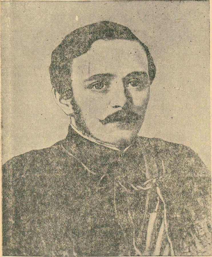
Михаил Юрьевич Лермонтов.

Портрет работы художника Астафьева.