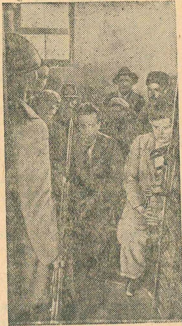
Захватенные немецкими фашистами сербские партизаны в ожидании расправы.

ожесточенную войну против фашистских оккупантов. Партизаны хорошо обеспечены оружием. Югославские крестьяне снабжают их продовольствием