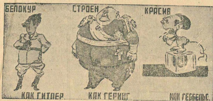
Рисунок Б. Ефимова. (Окно ТАСС № 22).

Согласно фашистской расовой теории истинный ариец должен быть: