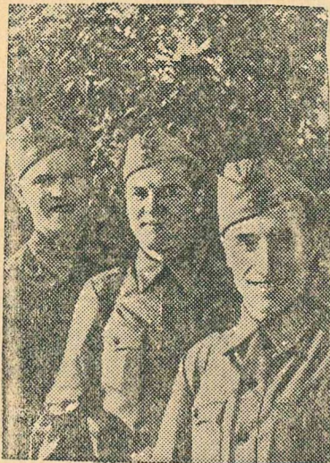
Московские физкультурники идут на фронт добровольцами.

У каждого рабочего есть одно хорошее качество: он готов в любую минуту помочь отстающему товарищу, готов дать совет, указание. Взаимопомощь в работе — самое важное и ценное качество советского человека. Это качество очень часто проявляется среди рабочих нашего коллектива. Так, рабочие эксплуатации после своей работы часто идут на более трудные участки погрузочно-разгрузочных работ. 23 июля к нам прибыли вагоны целлюлозы. Эти вагоны нужно было разгрузить срочно, за очень короткое время. С этой работой