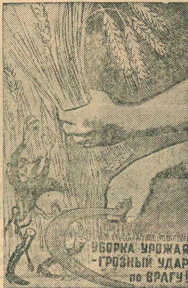
Рисунок худ. Куерыныксы. (Репродукция с плаката, выпускаемого издательством „Искусство“).