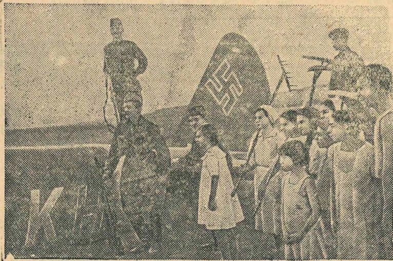
Действующая Красная Армия. Фашистский самолет, сбитый отважными советскими летчиками.

рия, оккупированная противником. Начиная с 2 августа, грузы, направляющиеся в Финляндию и из Финляндии считаются контрабандой и подлежат задержанию.