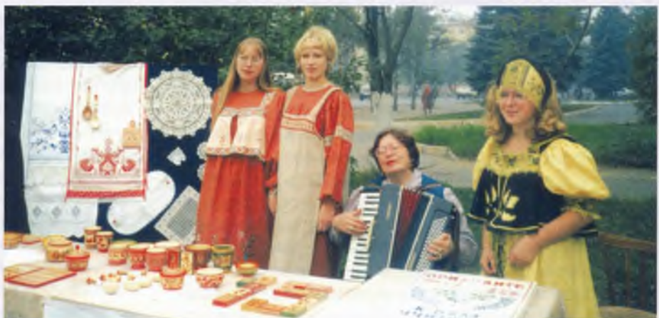
Ярмарка «Истоки» традиционно проходит в ГОУ «ПЛ № 31» (г. Вологда). 2004 г.