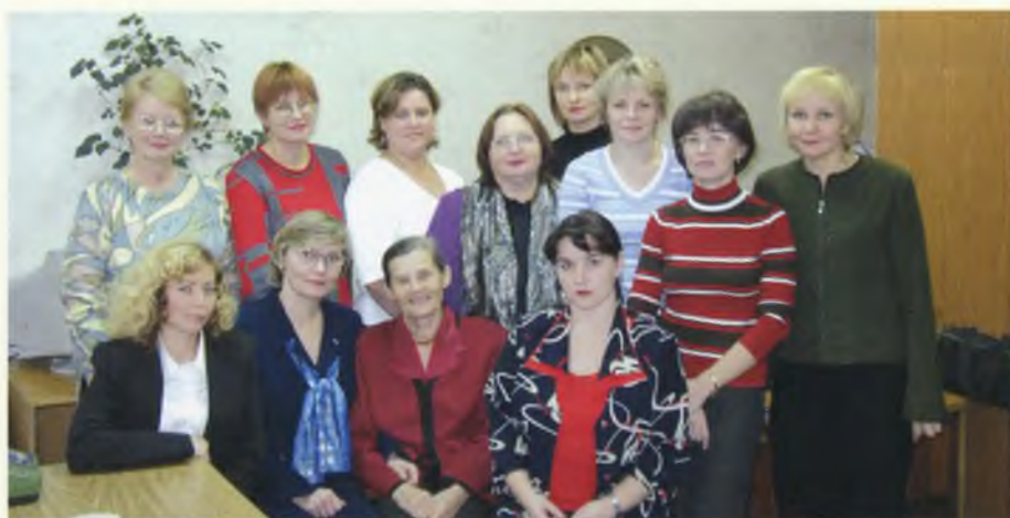
Педагоги и методисты учреждений дополнительного образования детей г. Череповца - активные вкладчики и пользователи банка.

На основе информационного массива банка организуется обучение педагогов. В процессе обучения углубляется, становится более адекватным понимание проблем, способов их решения, моделируется собственная деятельность.