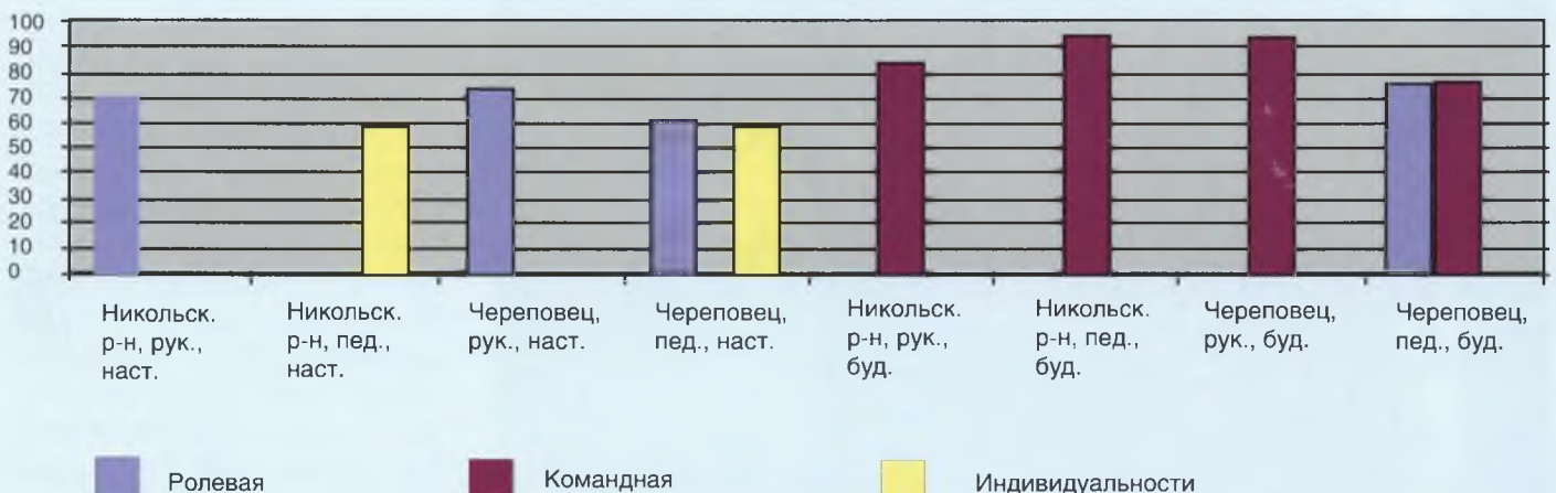
Сравнительные данные по доминирующей оргкультуре, полученные от различных категорий педагогических работников

Полученная информация, на наш взгляд, может быть полезна руководителям и педагогам образовательных учреждений, расширяя знания об организационной культуре учебного заведения, а в практической работе, позволяя диагностировать существующие культуры и их возможные изменения.