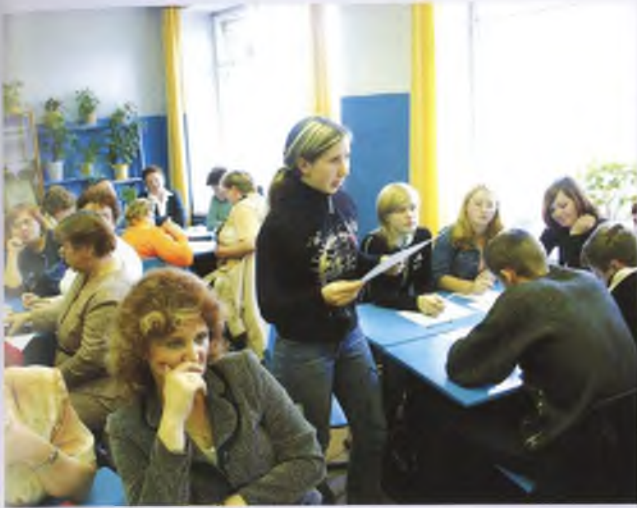
В обсуждении школьных проблем принимают участие старшеклассники.

гическим дополнением ее является программа «Здоровье». Интересен опыт работы учреждения по созданию и реализации подпрограммы «Развитие образовательного интереса», проведению мониторинга управления образовательным процессом с учетом теории педагогического менеджмента.