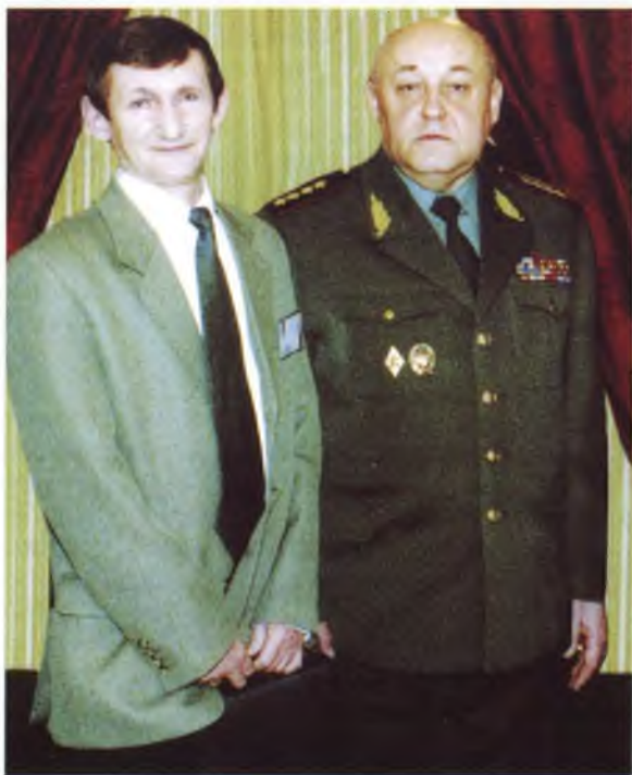
Автор статьи и начальник Генерального штаба Вооруженных Сил Российской Федерации генерал армии Ю.Н. Балувеский на конференции в Санкт-Петербурге.

В Вологодском институте права и экономики патриотическому воспитанию отводится особое место. Создан музей истории института, красочно оформлены стенды по истории родного края. В День защитника Отечества, в День Победы и в другие памятные даты я всегда вижу в почетном президиуме ветеранов Великой Отечественной войны.