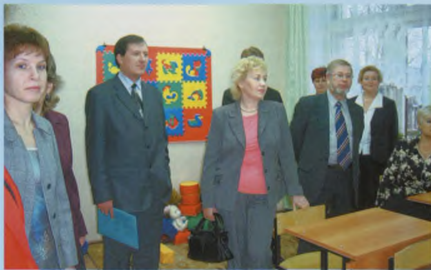
Знакомство с опытом работы специальной (коррекционной) общеобразовательной школы VIII вида.

В настоящее время педагогам приходится работать с неоднородным контингентом детей. Реальная практика образования испытывает потребность в педагоге-профессионале, способном к работе с различными категориями детей (детей с особенностями в развитии, одаренных детей, детей - представителей различных этнических и субкультурных общностей). Особые требования следует предъявлять к психологической компетентности учителей классов коррекционно-развивающего обучения, реализовывать программы повышения их квалификации. Управлением обра-