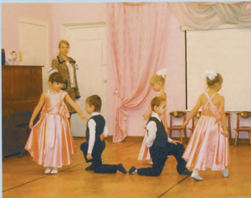
Приветствие гостей воспитанниками МДОУ № 32 «Солнышко».

фективность. Сегодня не представляется возможным представить обобщенные данные по области из-за отсутствия службы сопровождения в большинстве районов, можно только показать результативность отдельных образовательных учреждений.