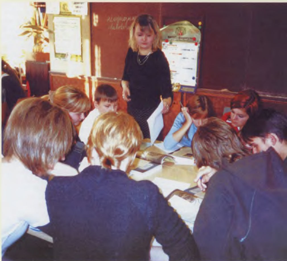
Урок по учебнику «Живое право».

Данные виды деятельности входят как составная часть в технологию развивающего обучения, которая в наибольшей степени, на мой взгляд, применима при изучении экономико-правовых дисциплин и является неотъемлемой частью всей современной системы образования и главным фактором формирования экономико-правовых компетенций учащихся.