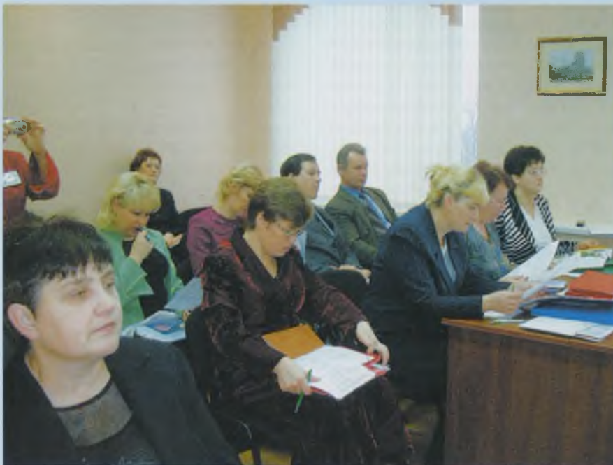
Работа участников коллегии с нормативными документами.

Участникам коллегии был представлен анализ состояния службы комплексного сопровождения детей в образовании, перспективы ее развития, а также опыт муниципальных служб комплексного сопровождения Сокольского, Вологодского и Тотемского муниципальных районов, образовательных учреждений Вологды и Череповца.