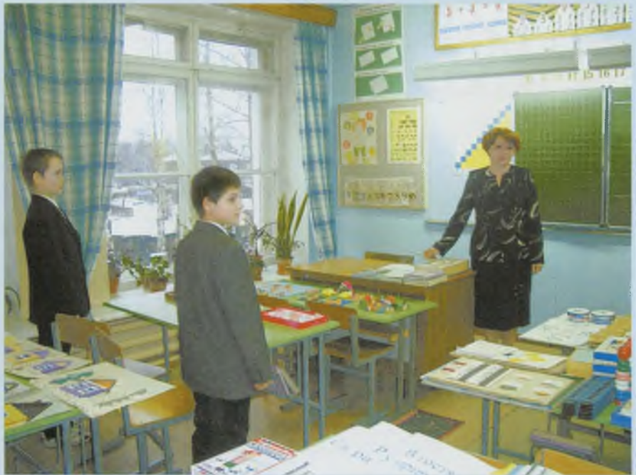
На занятии в СКОШ VIII вида.

Нас тревожит количество детей, не охваченных всеобщим, но оно тоже уменьшается в течение последних трех лет. Отсев и отчисление детей, не имеющих основного образования, по сравнению с 2003 годом уменьшился в два