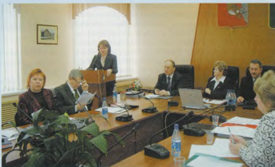
Пленарное заседание в администрации Сокольского муниципального района.

22 - 23 ноября на базе управления образования администрации Сокольского муниципального района проходила коллегия департамента образования Вологодской области. Основными ее задачами было выявление возможностей службы комплексного сопровождения в решении проблем модернизации образования, а также демонстрация реальных достижений, которые уже есть у специалистов службы.