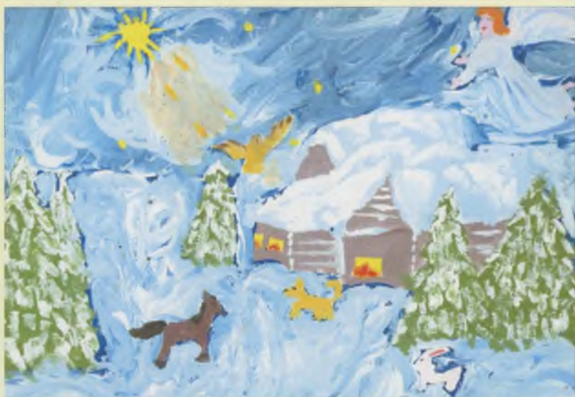
«Радость на земле», Валя Сухарева, 12 лет