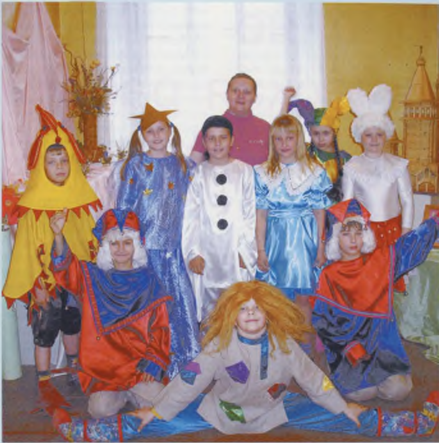
В Новый год сказка чудная ведет. «В гостях у домовенка Кузи».

Эти позитивные изменения детей дают коллективу структурного подразделения силы для дальнейшей плодотворной работы.