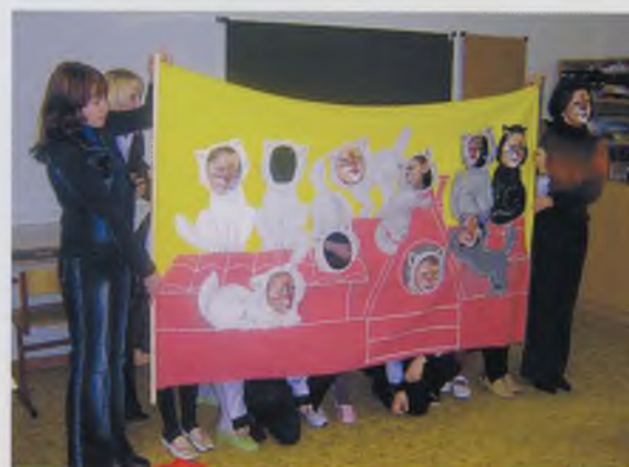
Творческая мастерская «Веселые котята». Белозерский педколледж. 2005 год.