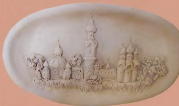
«Древняя Вологда» (керамика). Сидорова Наталья.