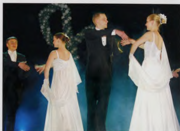
Ансамбль бального танца Сокольского педколледжа готовится поприветствовать участников очередного конкурса.