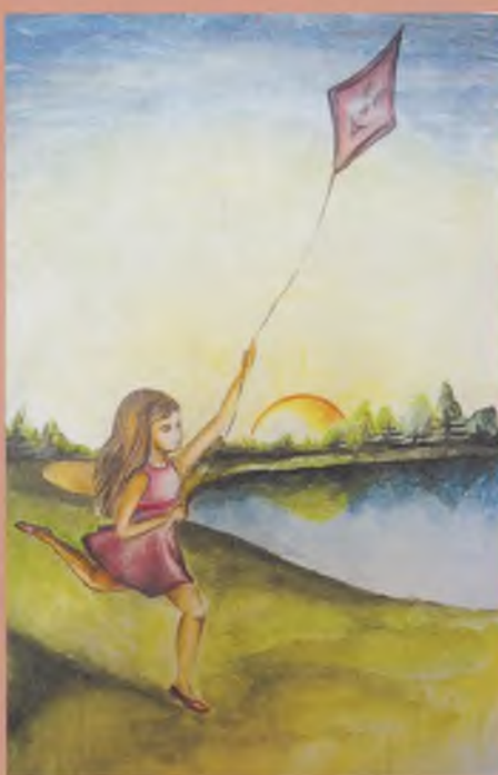
«Мечта» (пастель). Плюснина Виктория.