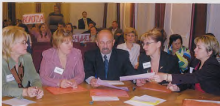
Жюри конкурса. 2006 год.

Ежегодный студенческий конкурс «Путь к профессии учителя» - заявка на высокую профессиональную подготовку выпускников педагогических колледжей области.