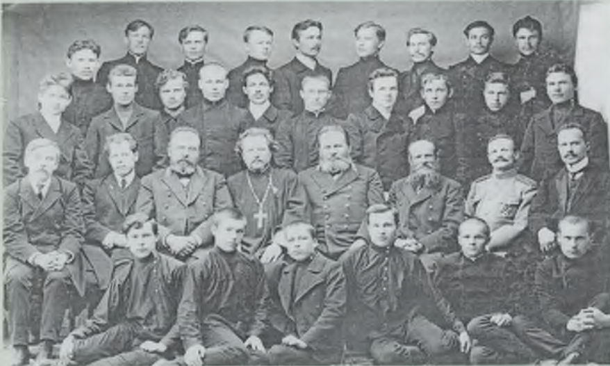
Преподаватели и воспитанники Тотемской учительской мужской семинарии. 1915 год.

витие будущего учителя, на удовлетворение образовательных потребностей населения, в том числе на подготовку учителей для детей малых народностей, вызвала появление карельского языка как учебного предмета в Вытегорской учительской семинарии, зырянского языка в Тотемской учительской семинарии. В группы, изучавшие эти языки, набирались все желающие.