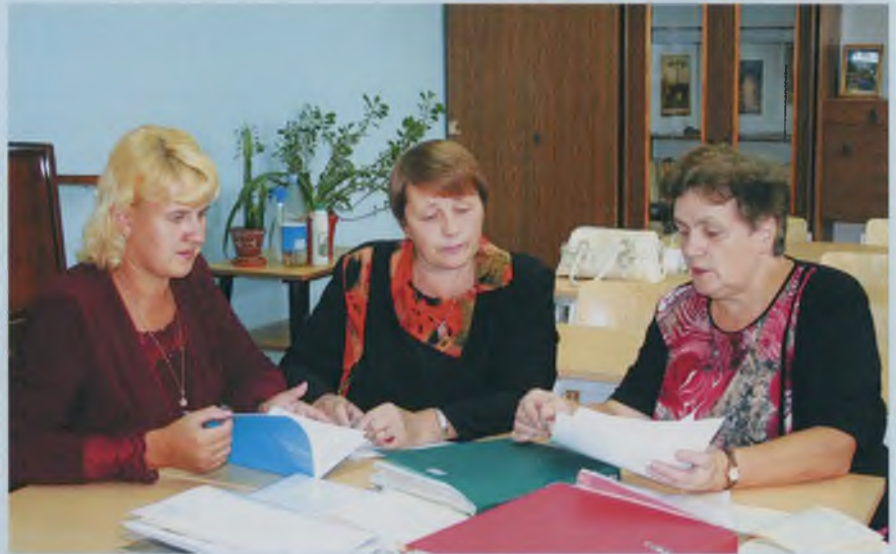
Творческая группа методического объединения преподавателей математических дисциплин при подготовке к областному семинару.