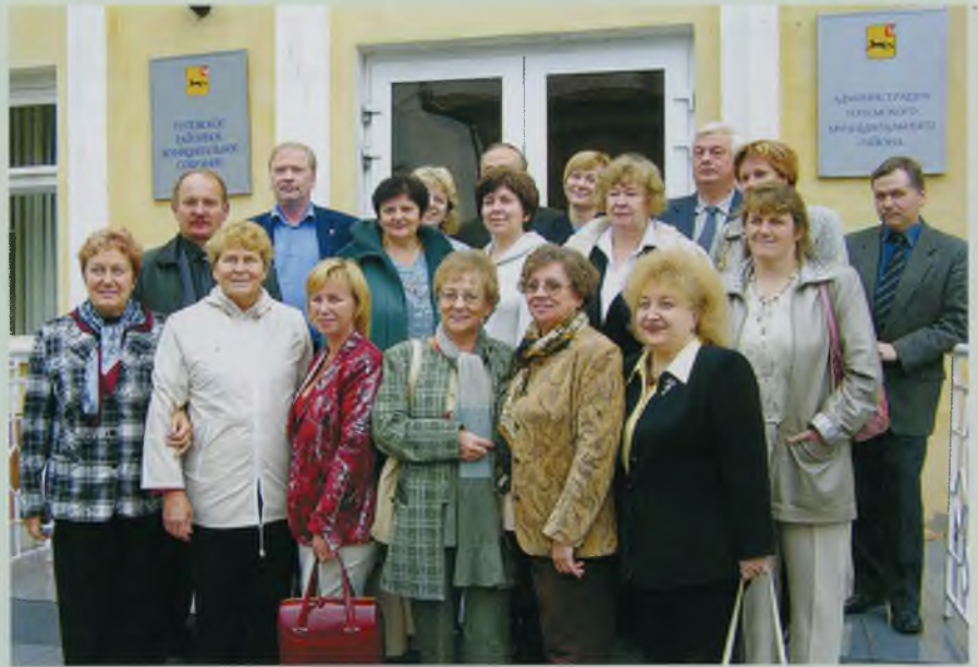
Семинар директоров педколледжей Северо-Западного федерального округа. Вологда - Тотма - Великий Устюг. Сентябрь 2006 года.

Заметно повышается профессиональный уровень педагогов. Более 50% преподавателей колледжей имеют высшую квалификационную категорию, девять человек являются кандидатами наук, 24 - аспирантами и соискателями. Развитию исследовательской культуры педагогов способствует организация научно-практических конференций областного и межрегионального уровня по проблемам непрерывного педагогического образования, преемственности дошкольного и начального образования, социальной адаптации выпускников с участием ученых Вологды, Череповца,