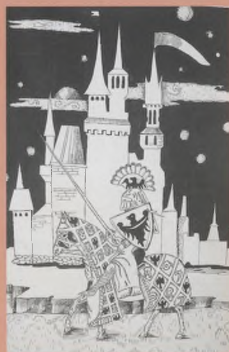
«Средневековый рыцарь» (графика, тушь). Мушин Александр.