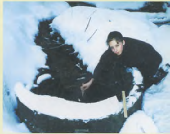
Измеряем температуру родниковой воды.

Подобная рефлексия может быть своеобразным подведением