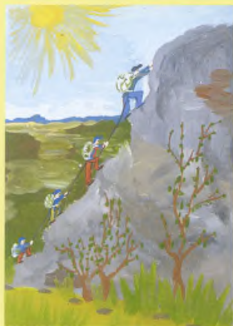
«Семья скалолазов», Артур Баранов, 10 лет.

Большая семья собралась за столом, Здесь каждый уже не считается «ртом». Про этих не скажешь: «Сидят едоки», - За общим столом собрались мужики. Вот в красном углу бородастый отец, Он хоть и седой, но еще молодец! По правую руку пристроилась мать, Морщинки давно перестала считать. Красивые снохи, как с русских икон. В застолье порядок царит и закон. Детишки без счету. Одна лишь беда, Что это бывает, увы, не всегда. Один в Красноярске, в Тольятти другой, А младшенький самый осел под Москвой. На месяц слетятся, и то через год, Ну что тут сказать - беспокойный народ! Грустят старики, но горды за детей - Взрастили хороших и добрых людей!