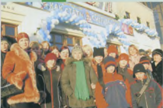
Поездка воспитанников детского дома в Москву по приглашению студентов МИРБИСа.

Мы надеемся, что наша дружба продлится многие годы, так как этого хотят дети-сироты и студенты.