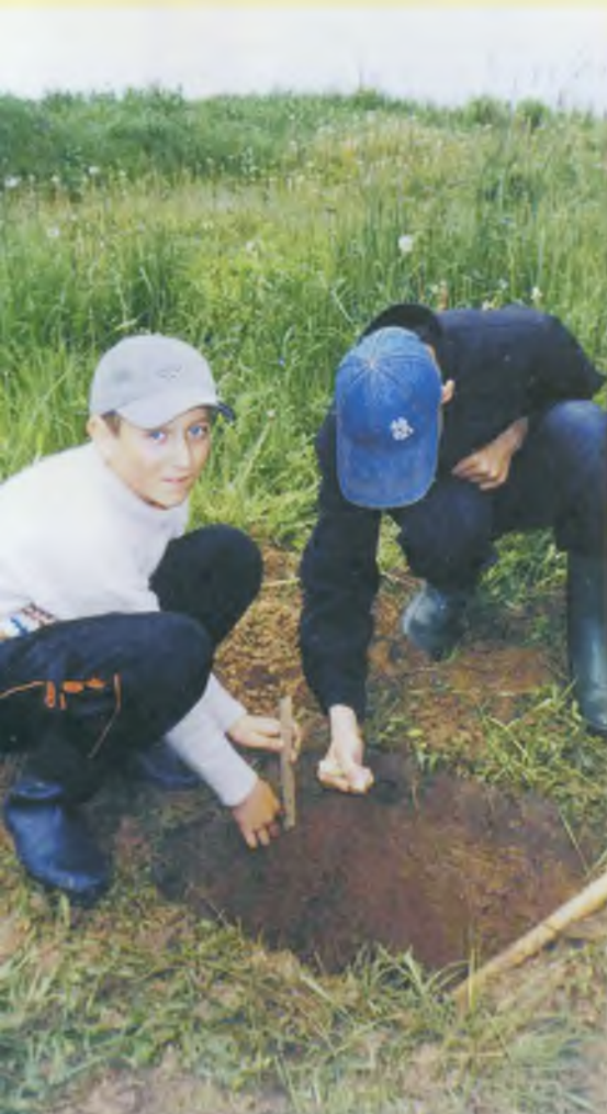
Исследуем почвенный разрез.

На уроках географии и во внеклассной работе у учителя есть возможность обратиться к методу проектов.