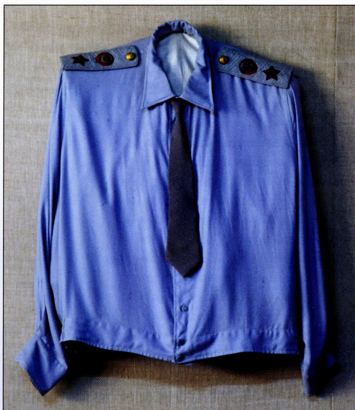
▲ Рубашка И.С. Конева