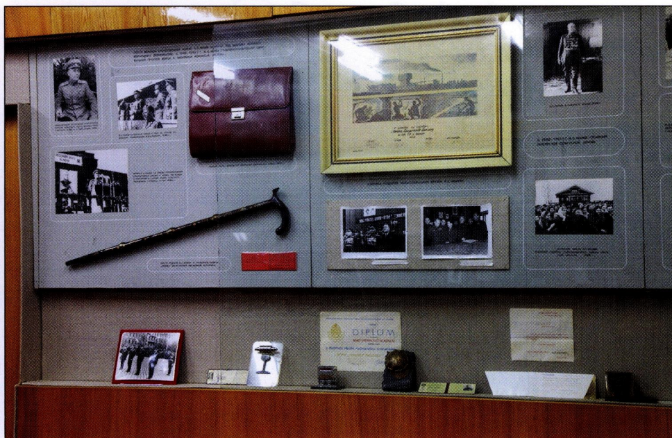
▲ Экспозиция дома-музея

маршала Ивана Степановича Конева. Здесь собраны вещи маршала — его военная форма, ордена и медали, карты основных операций, которые проводились под командованием Ивана Степановича, книги из его личной библиотеки,