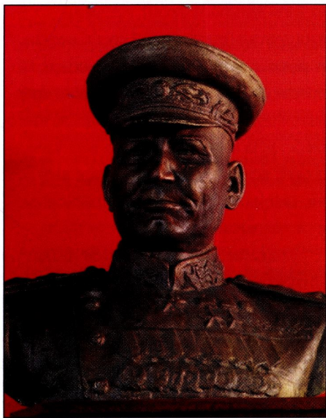
▲ Бюст военачальника в лектории дома-музея