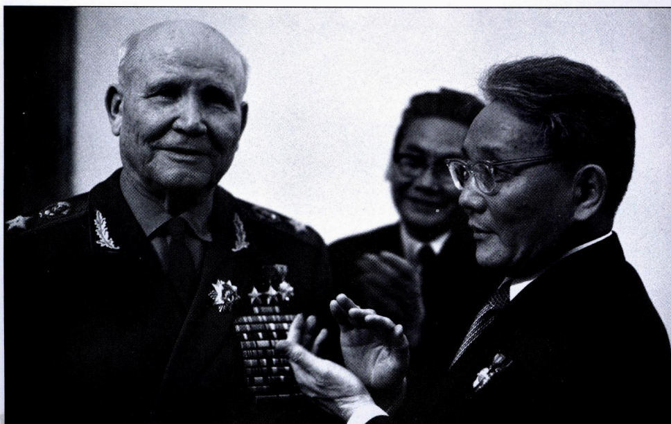
▲ Председатель Совета министров Монголии Цеденбал поздравляет И.С. Конева с присвоением ему звания Героя Монгольской Народной Республики. Фотография 1972 года