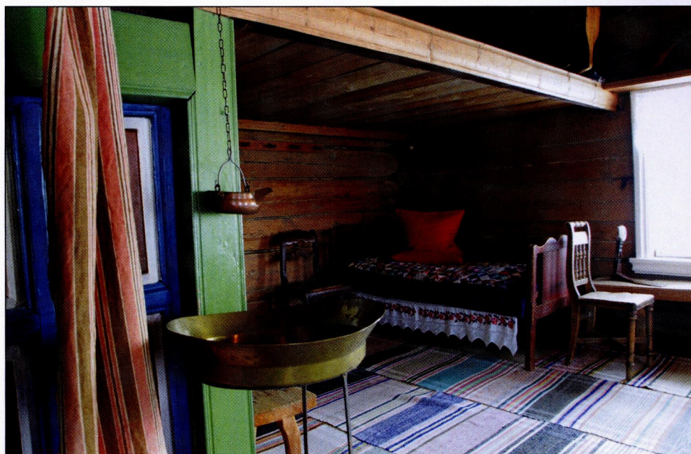
▲ Традиционная обстановка сельского дома

Большое значение в доме имел красный, или парадный угол. Он был расположен по диагонали от печи и всегда хорошо освещался. Этот угол всегда выделялся из общего интерьера, его старались украсить цветами, вышивками, позднее — лубками или открытками. Но главным украшением красного угла являлась божница — угловые полочки, покрытые красиво вышитыми рушниками, с иконами и лампадкой. Из-за этого угол еще называли святым. Стол тоже традиционно располагался в красном углу. Здесь проходили будничные трапезы семейства,