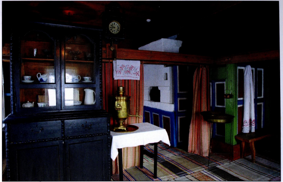
▲ Фрагмент интерьера

Кровать, стоящая в доме Коневых, — это, конечно, не просто украшение, так что она определенным образом указывает на то, что интерьер принадлежит к началу XX века. Декоративную функцию выполняют простыни с нарядными подзорами, яркое лоскутное одеяло и красные подушки.