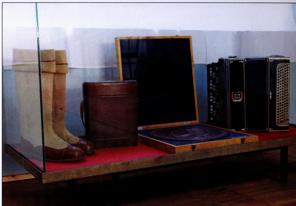
▲ Вещи семьи И.С. Конева

Только когда в 1918 году в деревню приехал его племянник Иван Степанович Конев, которого отправили подавлять кулацкий бунт в нескольких волостях Никольского уезда, между ними разгорелась нешуточная ссора на почве разногласий по поводу революции и нового правительства. По свидетельствам