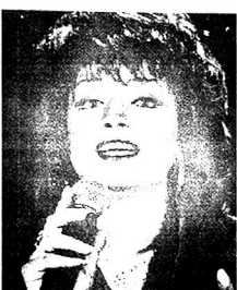
«Те бы их откопали?»

- Как? - Отказываться ходить на такие концерты, требуйте возврата ваших денег, насколько я знаю - немалых. В конце концов, кидайте на сцену тухлые помидоры... Олея ГАБЕОР.