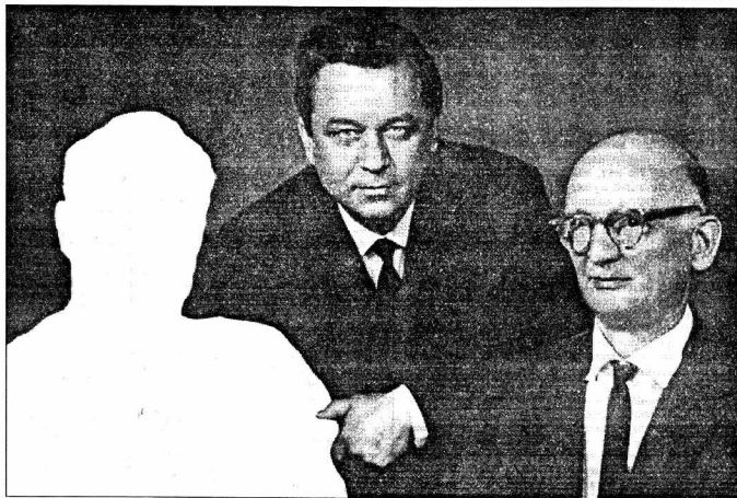
ты, когда он особенно остро боялся провала. Я спросил его: "А что самое страшное в вашей профессии?" Конон ответил: "Больше всего я боюсь, что во сне заговорю по-русски..."

Наши читатели, конечно, помнят эпизод из телефильма "Семнадцать мгновений весны", когда Максиму Максимовичу Исаеву перед тем, как ему нужно было ехать в Испанию, Центр устроил встречу с женой в немецком ресторанчике "Элефант". Помните этот безмолвный разговор глазами двух любящих, так давно не видевших друг друга людей?