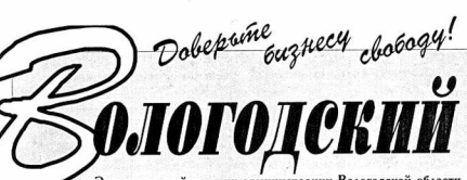
Экономический вестник администрации Вологодской области

И все же предварительные результаты навигации говорят о том, что речной флот работает и может еще лучше работать, есть все условия для этого. Речной транспорт будет востребован и в следующем году, если не хотим.