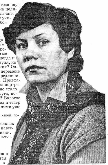
Беседовала Елена ПОПОВА.

И оценивает свой характер? Я бедовая была. В четыре года научилась водить трактор. Это за целине. Паша сидел сзади, а я рычагом дергала, сильная была. Всегда училась самостоятельно, перебрала много: и медсестрой, и киномехаником работала.