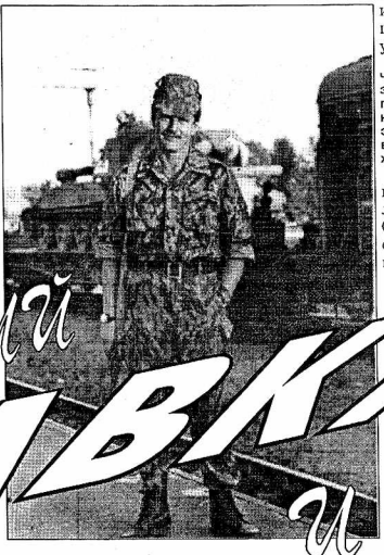
Майор Н., тот самый, которого наши читатели, возможно, помнят по публикации в "Зеркале" от 3.02.95 "Груз-200", воевал в Чечне в качестве начальника штаба дивизиона самоходных гаубиц и вернулся домой, когда начали выводить войска.