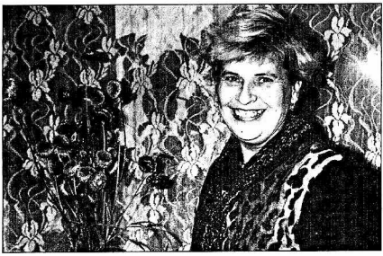
Приехали мы вечером, и ни за что бы без посторонней помощи не наши гостиному, скромно притулившись с торца важного здания "Череповецкомбанка". Всем известно, что гостиница - визитная карточка любого города. Какая же она здесь?

На автобусном вокзале я обнаружила, что сапоги у меня, мягко говоря, не совсем чистые. Подходящий лужик не нашла "про себя" махнула рукой: "Подумаешь, не в столицу и еду..." Так и привезла вологодскую грушу в Кадую. И было стыдно, потому что в Кадуе в грязных сапогах не ходят - лужи здесь сухая и посчаная, а местность похожа на курорт - кругом сосенки и березки.