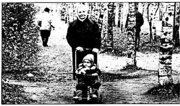
порт - Череповец.

Кадуцкий район расположен на западе Вологодской области. Он занимает территорию более 3000 кв. км, из них на поселок Кадуя приходится около 44 кв. км. По Кадуцкому району проходят важнейшие транспортные магистрали, соединяющие Центральную Россию с Уралом, тем самым легко устанавливаются активные деловые связи с Санкт-Петербургом, Ярославлем, Архангельском, Северодвинском. Большую роль в установлении этих связей играет расположенный в 50 км от районного центра морской