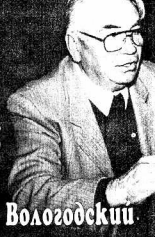
Вологодский портрет Министр здравоохранения и медицинской промышленности РФ ЦАРЕГОВАЕВЪ

В адрес Губернатора области Николая Подгорнова пришла правительственная телеграмма из Москвы... "Поздравляю с открытием предприятия по производству детского питания..."