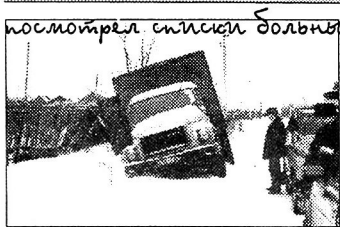
посмотрел списки больщих... и узнал машину