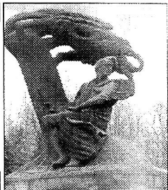
НА СНИМКЕ: ПАМЯТНИК Ф.ШОПЕНУ В ЗАРХАВСКОМ ПАРКЕ ЛАЗЕНКИ.

Передача выйдет в эфир по Санкт-Петербургскому каналу 25 февраля в 13.20.