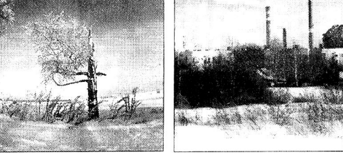
Р 50-летие Победы

Мы приняли участие в проведении Всероссийских дней защиты экологической опасности, организовывали озеленение городов.