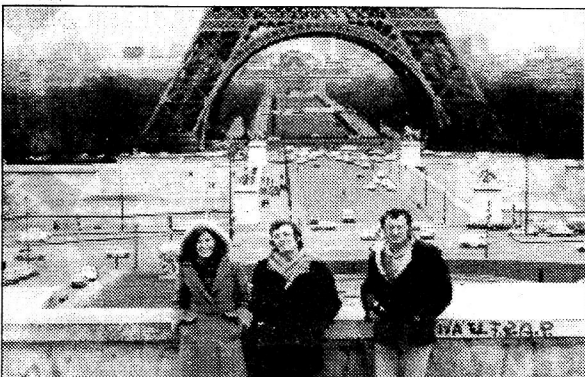
(публикуется впервые).