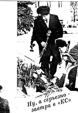
Ну, а серьезно завтра в «КС»