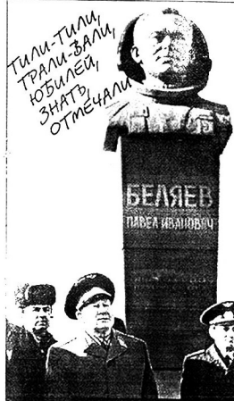
* БЕЗ ЗЪЯКІХ-ЗЪЯКІХ