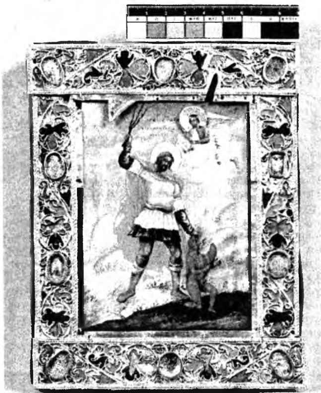
Рис. 2. Икона «Св. Никита, побивающий беса». Общий вид после реставрации

Через 3 года все работы по «возобновлению» интерьера Успенского собора были завершены. Установлен новый иконостас с золочеными каннелированными колоннами коринфского ордера. Он был заполнен иконами, написанными в стиле «ученой» академической живописи. При этом в архитектуре, скульптуре и живописи иконостаса формы раннего русского классицизма искусно сочетались с отблесками барокко в виде пышной и затейливой золоченой резьбы по дереву, обрамлявшей картуши и клейма праздничного регистра [7]. Устюжане, пришедшие на церемонию освящения собора в 1786 г., были поражены великолепием и благородной роскошью нового интерьера их древнего городского собора, в светлом и обширном пространстве которого теперь преобладало сдержанное созвучие белоснежных стен с золотом иконостаса и киотов, которое в контрастном сопоставлении с цветовыми аккордами старых икон и новой академической живописи создавало своеобразную величественную симфонию архитектурно-художественного ансамбля, возвещавшую и утверждавшую в далеком северном городе приоритеты русской культуры и процветающей Российской империи в рамках европейской цивилизации.