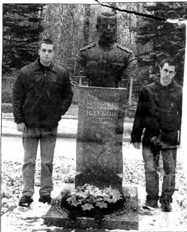
1 ноября 2004 года ребята из Вологодского поискового отряда возложили цветы к памятнику Александру Клубову.