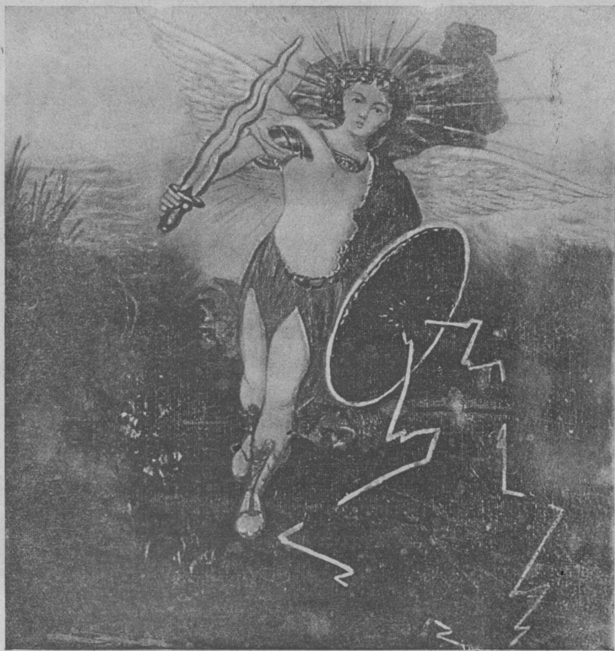
«Архистратигъ Михаилъ», раб. В. Л. Боровиковскаго.

На передней сторонѣ на дверкѣ ковчега: видѣнная Моисеемъ Купина и надъ нею образъ Пресвятыя Богородицы, именуемый