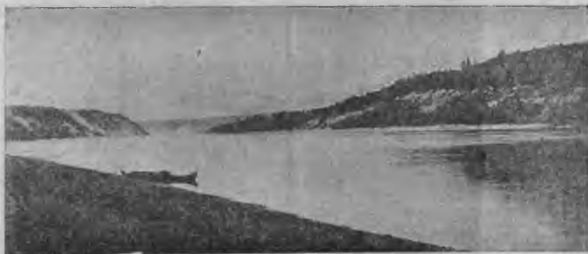
Рѣка Сухона передъ Верхней Тотмѳю.

Начались пожары... Городъ нѣсколько разъ погорѣлъ.