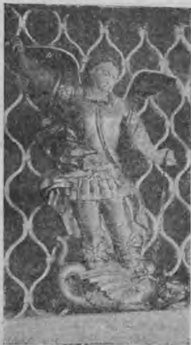
Рѣзная статуя Георгія Побѣдопоса въ Георгіевской ц. въ Тотьмѣ.

Шуйское... Два храма... и цѣлый рядъ домовъ, по обоимъ берегамъ Сухоны.